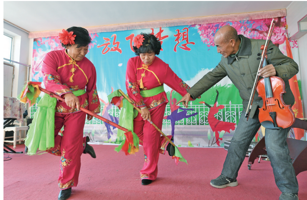
排练中互相纠正舞蹈动作。