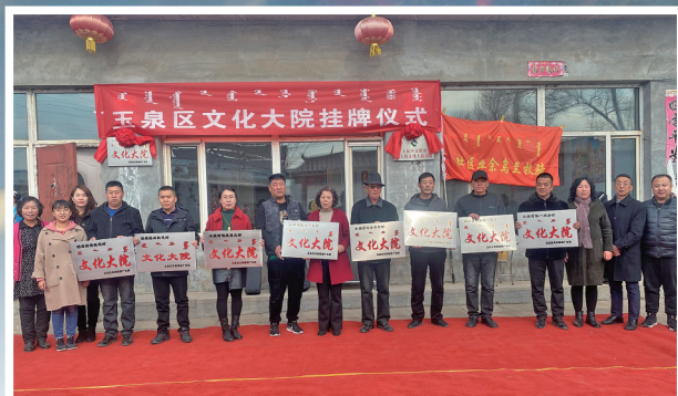
玉泉区文体旅游广电局选定9个符合条件的行政村设立文化大院。