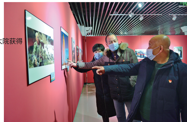
达赖庄文化大院获得

村民们一起创作的剧本5日是第34个国际志愿者日 自治区血液中心和北方新报、北疆应急保障志愿服务队等单位共同举办了 血脉相连 你我同行 无偿献血公益活动。来自我区多所高校的大学生志愿者及社会公益组织、爱心人士近500人参加了活动。