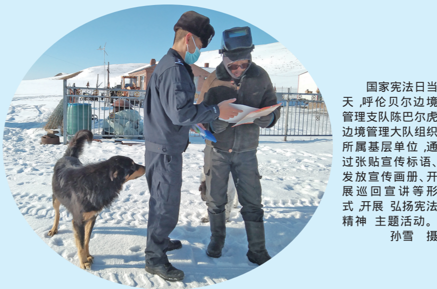
国家宪法日当天,呼伦贝尔边境管理支队陈巴尔虎边境管理大队组织所属基层单位,通过张贴宣传标语、发放宣传画报、开展巡回宣讲等形式,开展 弘扬宪法精神 主题活动。