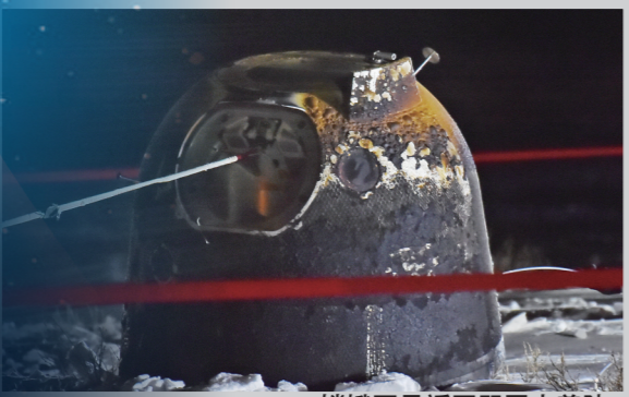
嫦娥五号返回器平安着陆。