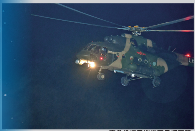
直升机搜寻嫦娥五号返回器。