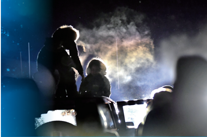
在极寒天气下工作的搜救队员。