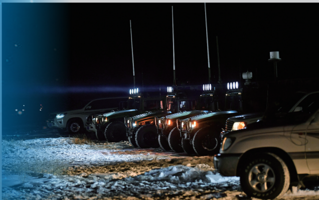
现场待命的保障车队。