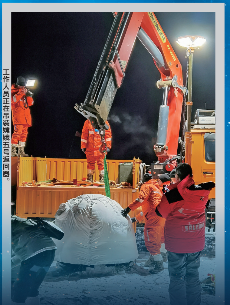
工作人员正在吊装嫦娥五号返回器。

“嫦娥奔月”梦想成真,中国航天未来可期。在星辰大海的征程中,我们必将创造更多奇迹!