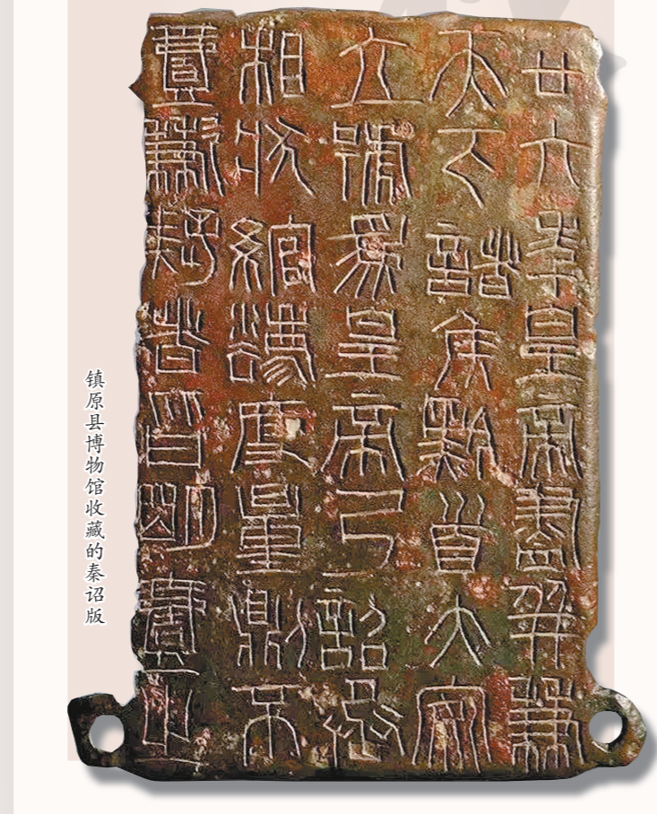
镇原县博物馆馆藏的秦诏版