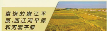
富饶的嫩江平原、西辽河平原和河套平原