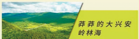
莽莽的大兴安岭林海