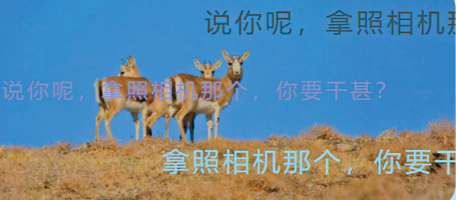
说你呢，拿照相机那个，你要干甚？