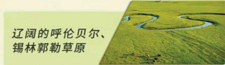
辽阔的呼伦贝尔、锡林郭勒草原