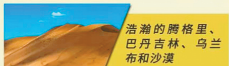
浩瀚的腾格里、巴丹吉林、乌兰布和沙漠