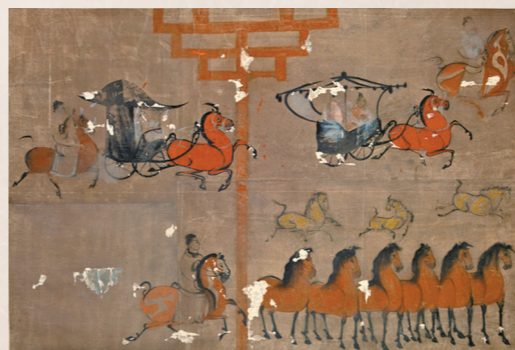
《使持节护乌桓校尉出行图》壁画摹本。