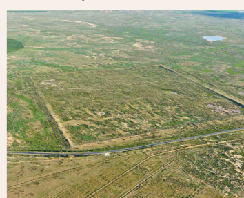
察汗不浪古城全貌。