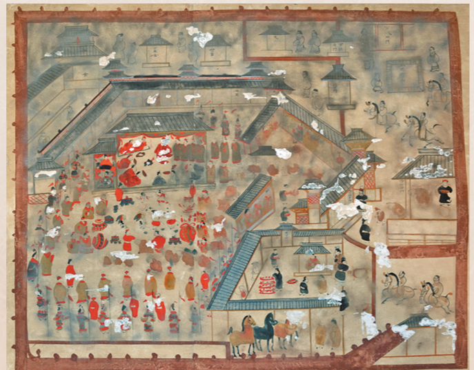
《护乌桓校尉幕府图》壁画摹本。

中室西北壁的《燕居图》、后室北壁的《武城图》描绘的是墓主人晚年养尊处优的生活场面,图中墓主人夫妇周围侍仆簇拥,墓主人居室内外金玉满堂,鸡鱼满仓,正如汉乐府诗《相逢行》中所言:黄金为君门,白玉为君堂,堂上置樽酒,作使邯郸倡,中厅生桂树,华灯何煌煌。