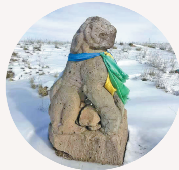
察汗不浪古城的石狮子。