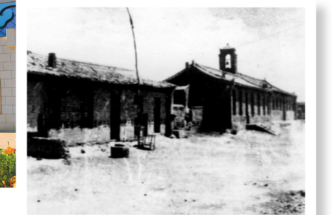
城川民族学院旧址。