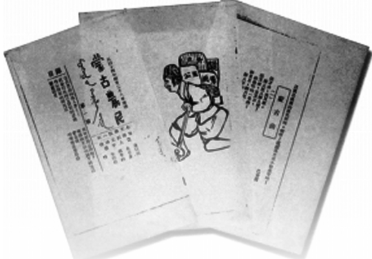
在蒙藏学校诞生的革命刊物——《蒙古农民》。

川河流,翻越几十年艰难险阻,最终星星之火成燎原之势,将一个满目疮痍、贫穷落后的旧内蒙古,变成了一个活力四射、前途光明的新内蒙古。在祖国大家庭的怀抱里,在党的坚强领导下,内蒙古经济发展实现历史性跨越,社会建设实现历史性进步,千里草原出现未曾有过的盛世,实现了伟大的飞跃。