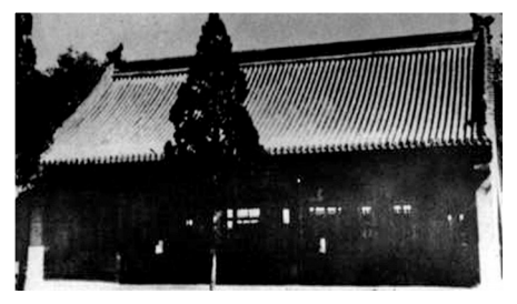
蒙藏学校旧址旧貌(西单小石虎胡同)。