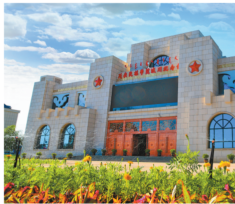
延安民族学院城川纪念馆。