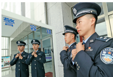
双胞胎兄弟执行任务前整理警容。