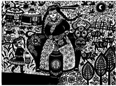
荣凤敏作品《乳香飘》