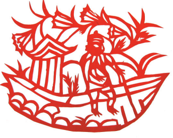
高粉梅作品《过黄河》