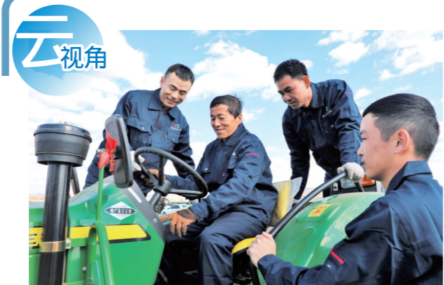
老师现场讲授拖拉机拖拽农机具使用技术。

一个协调人、一个领办人,推动项目开工前手续办理,解决项目建设中存在的困难和问题。并将重大项目推进情况纳入领导班子实绩考核目标,每月底对重大项目推进情况进行通报,在关键时间节点上定期召开集中调度推进会,在日常调度中及时发现、反馈问题,由旗级责任领导带领相关部门深入项目现场办公,解决困难和问题。下一步,我们将压实能耗双控目标责任,围绕转变方式、调结构、补短板、强弱项,因时因势调整优化项目储备的主攻方向,紧跟国家政策导向,加强项目策划、严把项目标准,科学谋划储备一批强基础、利长远、增后劲的重大项目,推动形成储备一批、开工一批、建设一批、竣工一批的滚动接续格局。扎赉特旗发改委主任秦银山介绍说。