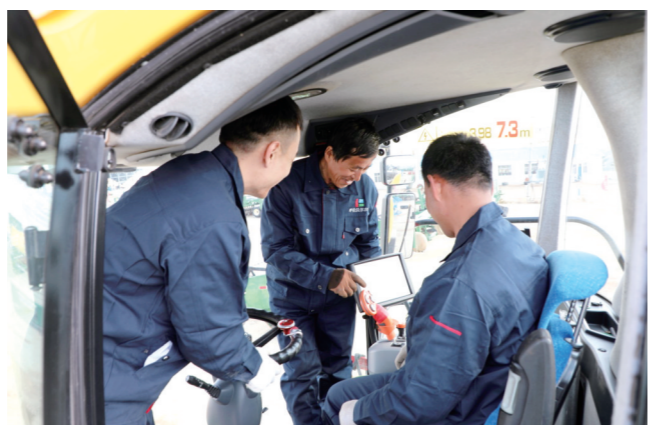
师带徒,学技能,师徒共同研究喷药机操作技术。