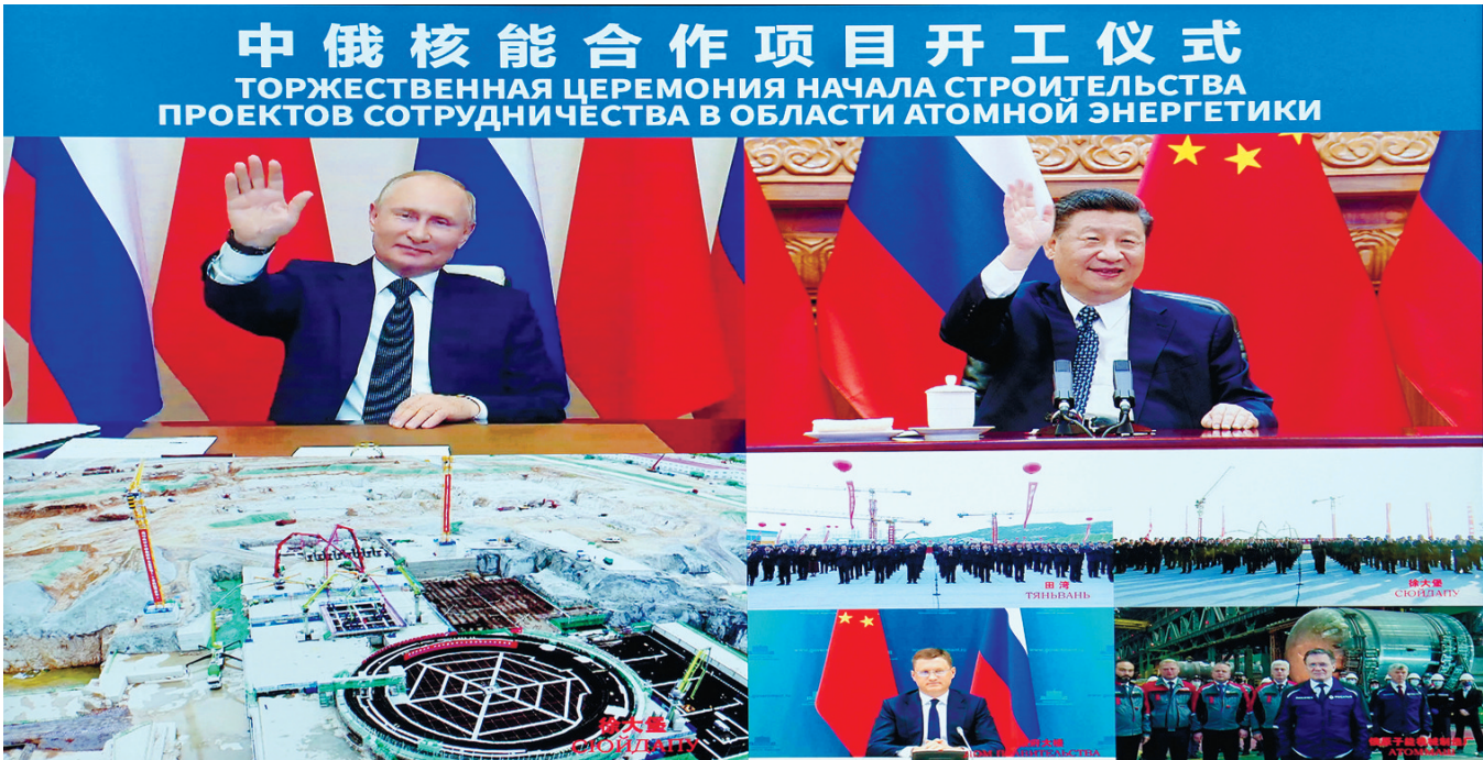
5月19日下午，国家主席习近平在北京通过视频连线，同俄罗斯总统普京共同见证两国核能合作项目——田湾核电站和徐大堡核电站开工仪式。