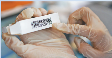
疫苗二维码需要与被注射人身份信息相对应。