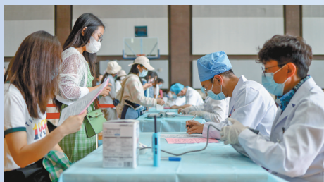
填写接种知情同意书。