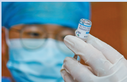
接种护士抽取新冠疫苗。