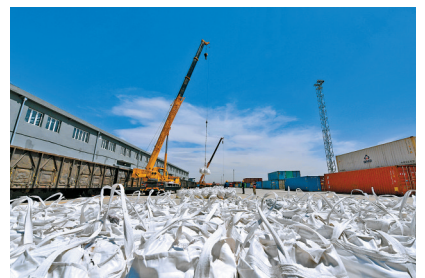
七苏木中欧班列物流枢纽基地。