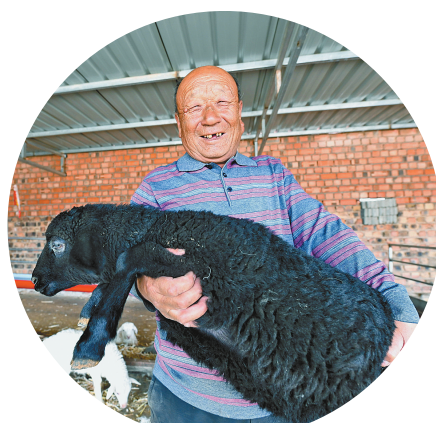
养殖户抱着羊羔露出了开心的笑容。