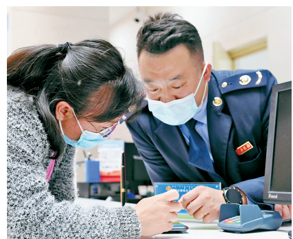
群众在乌兰察布市政服务大厅办理业务。