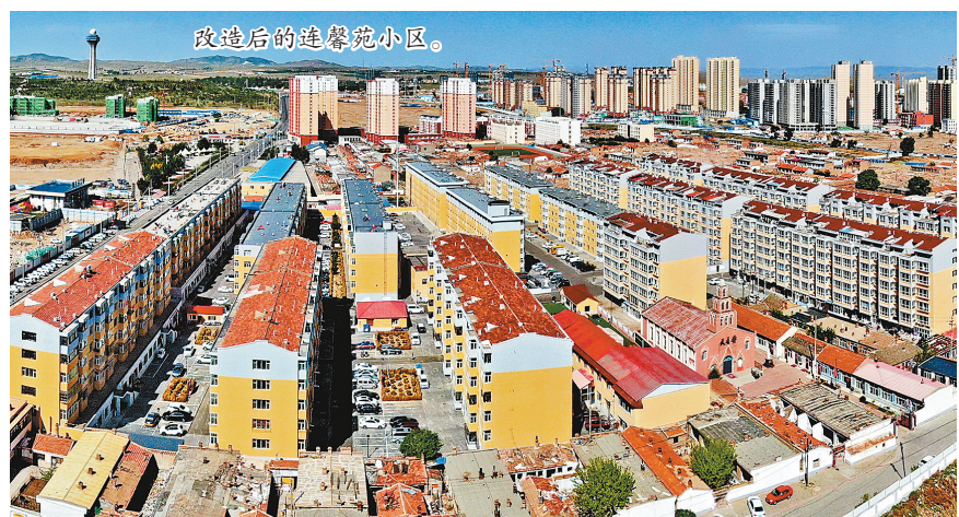
改造后的新建住宅小区。