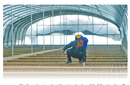
商都县七台镇喇嘛板村村民查看马铃薯长势。

与此同时，白泉山生态修复项目荣获“中国人居环境范例奖”，霸王河公园入选“国家湿地生态公园”老虎山、卧龙山和霸王岭河旧貌换新颜，它们与白泉山、霸王河并称为“三山两河”，如今已成为乌兰察布市生态保护建设的一张亮丽名片。