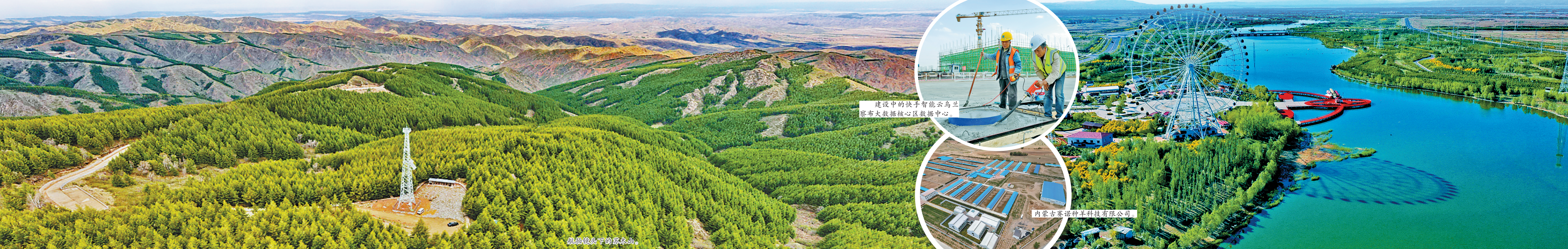
建设中的快手智能云乌兰察布大数据核心数据中心。

一个群众点赞的项目，一幕幕拼搏发展的镜头，清晰地记录着乌兰察布对旧动能“破”的革命，向新动能要“立”的效应的累累硕果。构建绿色制造体系，推广绿色设计和绿色产品开发，推行绿色工厂、绿色供应链和绿色园区建设……绿色，已经成为乌兰察布经济发展的新动力、新引擎。