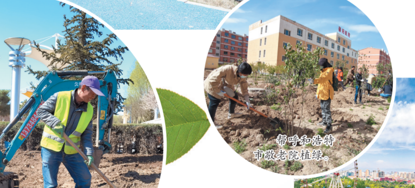
呼和浩特市 市徽会徽植树。