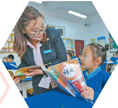
呼和浩特市玉泉区民族实验小学的学生在课堂上。

校园足球改革项目方面,共建成了4个国家级校园足球实验县、3个全国满天星训练营,1650所校园足球特色学校和593所特色幼儿园,在8所本科高校建设了高水平足球队。建成了从幼儿园、小学、初中、中职、普高、高职、大学校园、大学超级8个系列(学段)的分级杯赛体系。