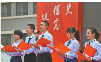
呼和浩特市第三十九中学的学生在朗诵《致我们的十四岁》。