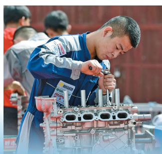
呼和浩特市机械工程技术学校的同学展示汽修技能。