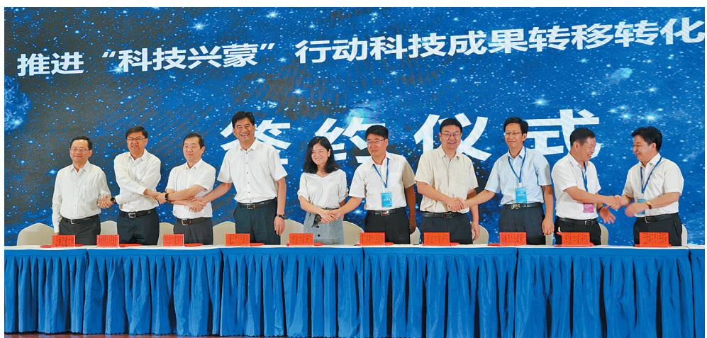
科技成果转化对接签约。