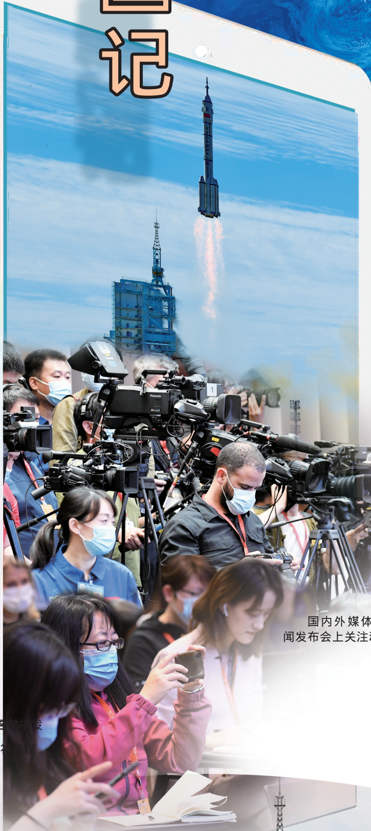
国内外媒体在新闻发布会上关注动态。