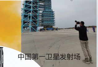
中国第一卫星发射场