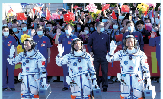
3名航天员即将登上神舟十二号载人飞船进入太空。