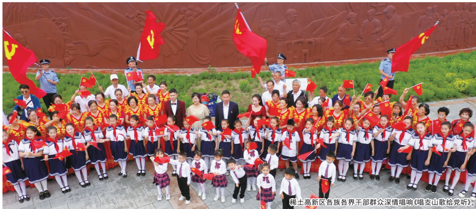
稀土高新区各族各界干部群众深情唱响《唱支山歌给党听》。

党史用心学,实事遂民意。自党史学习教育开展以来,包头稀土高新区认真贯彻落实党中央决策部署和自治区党委、市委工作要求,把开展党史学习教育与贯彻落实习近平总书记对内蒙古重要讲话重要指示批示精神紧密结合,与包头市“四基地两中心一高地”体系建设、担当作为、狠抓落实行动、打造全方位深层次一流营商环境等目标要求相结合,以深度学习、高标准立体化推动党史学习教育走深走心走实,切实把以人民为中心的发展思想厚植于心、付之于行。