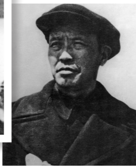
内蒙古自治区主席乌兰夫。