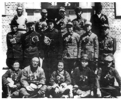
内蒙古自治区部分委员合影。