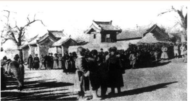
乌兰夫率内蒙古自治运动联合会总会机关人员前往王爷庙,沿途受到各族人民群众的热烈欢迎。