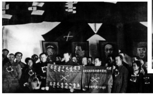
乌兰夫带领内蒙古自治区全体委员宣誓就职。