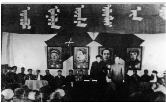
1947年4月23日,乌兰夫在内蒙古人民代表会议上致开幕词。