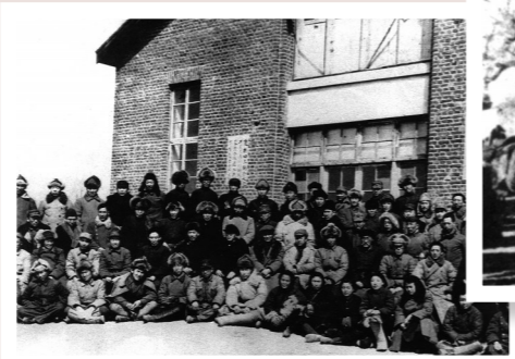
五一大会部分代表合影。

立足新发展阶段,内蒙古坚定不移落实“两个屏障”“两个基地”“一个桥头堡”的战略定位,瞄准主攻方向精准发力,更加积极主动地深化改革、扩大开放,下大气力打好优化营商环境翻身仗,切实做到扬长避短、培优增效,更好地服务和融入新发展格局。坚持共同富裕方向,坚持尽力而为、量力而行,补齐民生短板,破解民生难题,兜牢民生底线,做好巩固脱贫攻坚成果同乡村振兴有效衔接,不断夯实群众增收致富的基础。尊重自然规律、搞好顶层规划,统筹山水林田湖草沙系统治理,加大生态系统保护和污染防治力度,推动发展全面绿色转型,积极构建全域生态安全格局。内蒙古在全面建设社会主义现代化国家新征程中绘就以“绿”为底的崭新画卷。