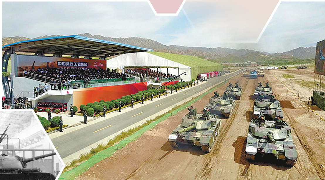
2017年8月16日,第二届 装甲与反装甲日活动在内蒙古第一机械集团公司试车场开幕。