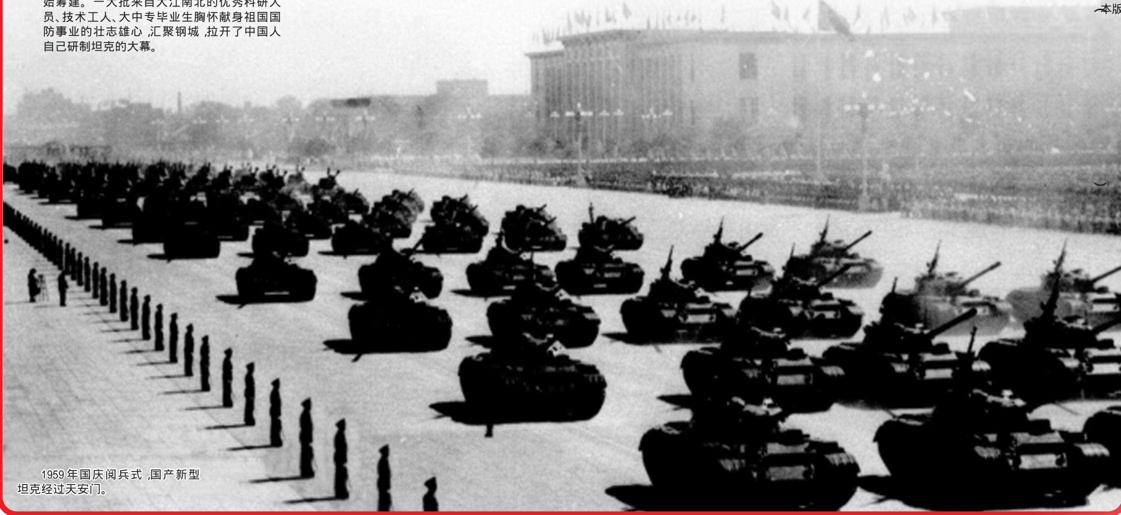
1959年国庆阅兵式,国产新型坦克经过天安门。

如今,内蒙古一机集团不忘初心,牢记使命,不断研发制造新型装备,坦克族谱不断丰富,现已形成了轮履结合、轻重结合、车炮一体协调发展,服务于陆、海、空、火箭军等多军兵种的研制生产格局,实现了涵盖战斗、保障、火力打击和一体化信息装备的拓展转型。各种新式装备在国庆阅兵式上屡次 亮相,接受几代党和国家领导人的检阅。