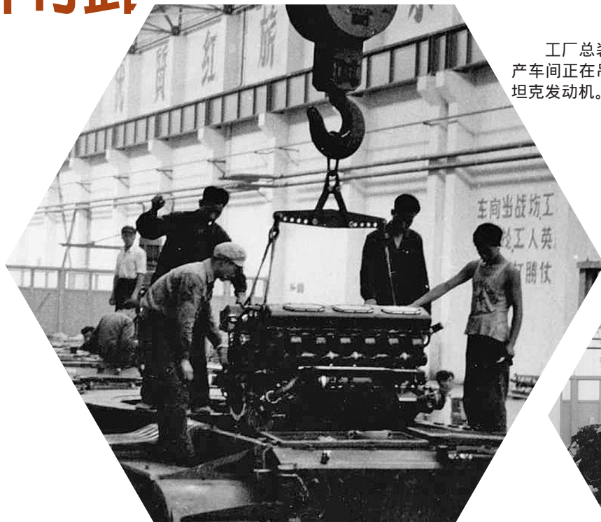
工厂总装生产车间正在吊装坦克发动机。