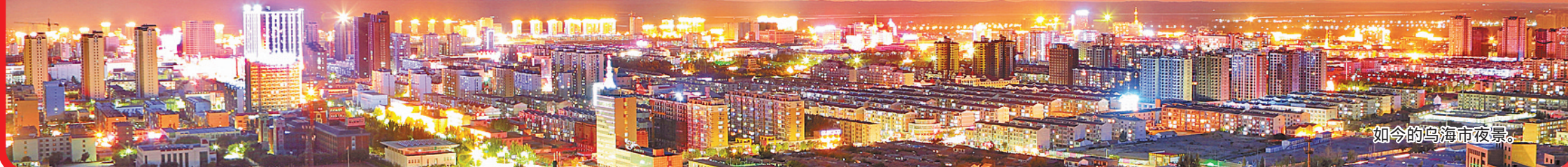
如今的乌海市夜景。