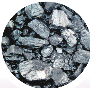
乌海矿区生产的原煤。