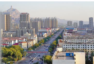
2019年的海勃湾。