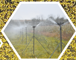
包头市固阳县发展节水灌溉项目。