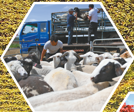
锡林郭勒盟锡林浩特市白音锡勒牧场牧民正在将羊装车。