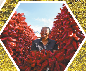
呼和浩特市托克托县农民种植辣椒喜获丰收。