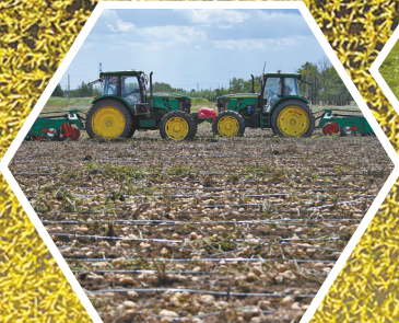
乌兰察布市察右前旗收获土豆。