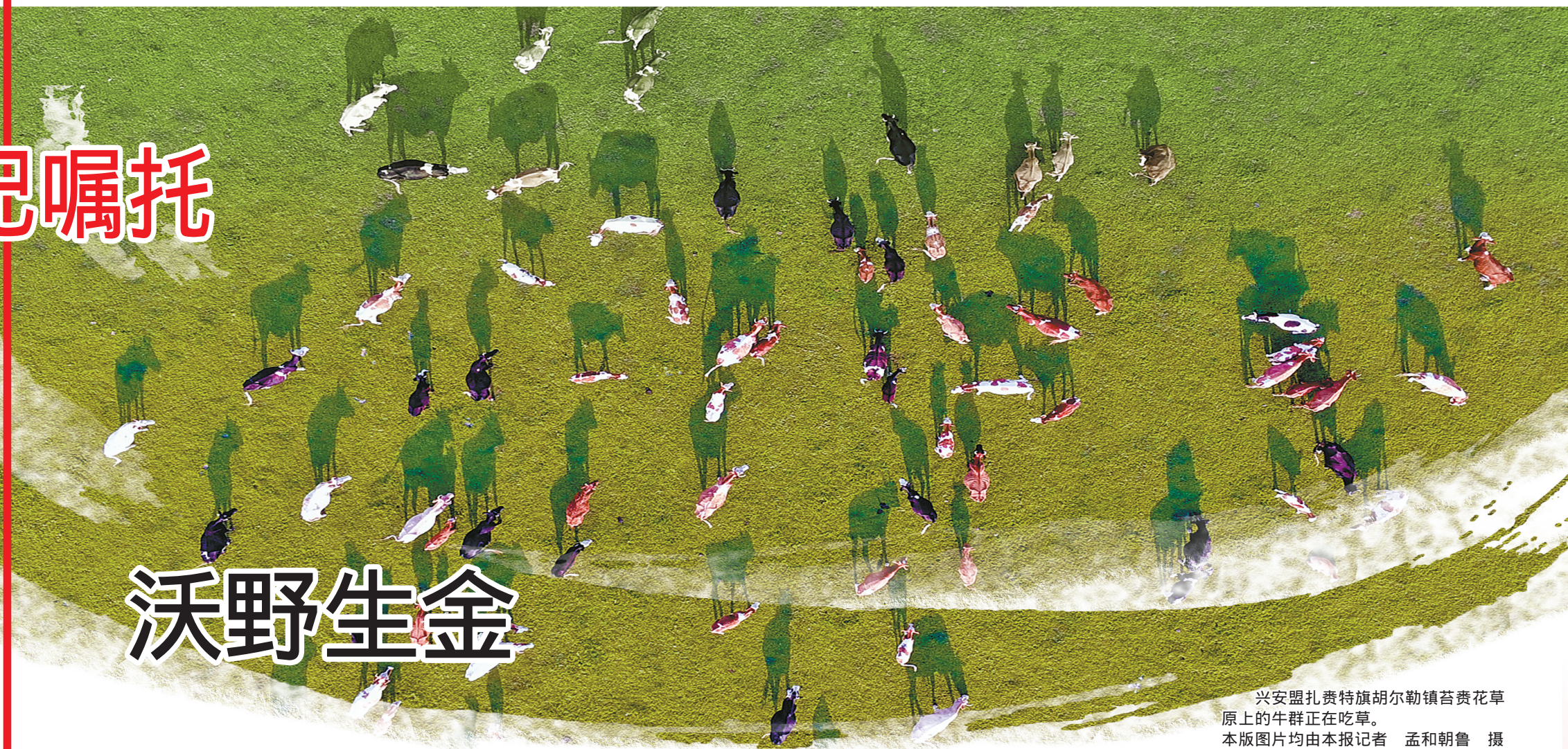
兴安盟扎赉特旗胡勒镇苔黄花草原上的牛群正在吃草。

执行编辑 策划 2021年 胡晓安 静 日 责任编辑 编 期四 制图 安宁 韩雪茹 石向军