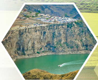
雄伟的黄河大峡谷。

最严密的法治 全面打响污染防治攻坚战,打好蓝天、碧水、净土保卫战,出台加强生态环境保护坚决打好污