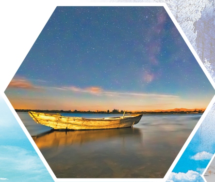
七星湖星岛。