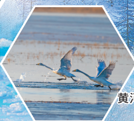
黄河湿地,天鹅天堂。