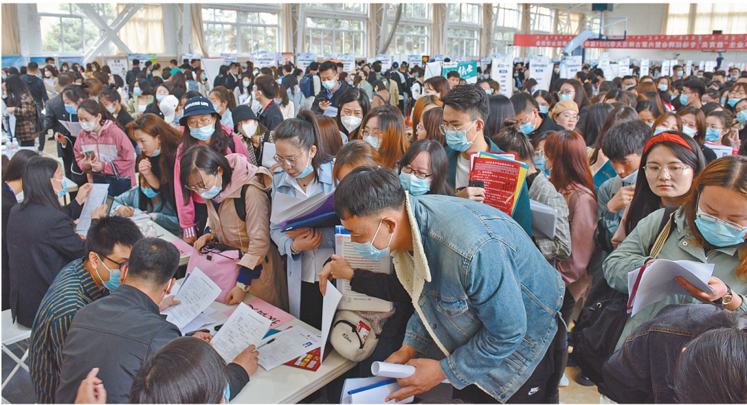
专场招聘会搭建就业平台。