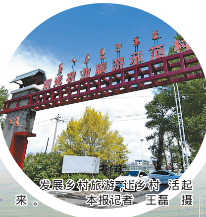
发展乡村旅游，让乡村“活”起来。