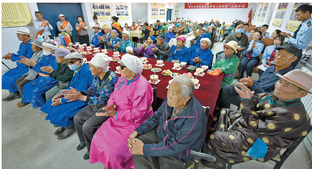
锡林郭勒盟阿巴嘎旗哈拉穆养老服务中心的老人们欢聚一堂，庆祝建党百年。

贯彻新发展理念，走高质量发展之路，民生红利加速释放，民生幸福不断加码。迈上幸福高铁，唱响欢乐草原曲，共同富裕路上一个不能掉队。