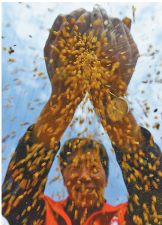
包头市固阳县粮食大丰收。

悠悠万事，民生为大。中国共产党始终初心不改，以人民为中心，为人民谋幸福。在内蒙古大地，民生答卷写满获得感、幸福感。