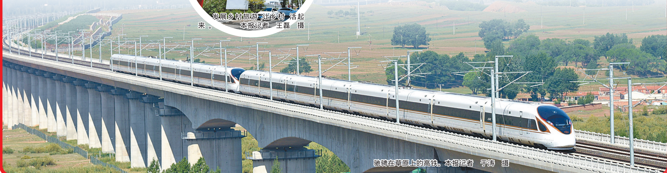
驰骋在草原上的高铁。