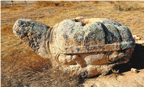
国公墓地的龟趺石雕。（资料图片）