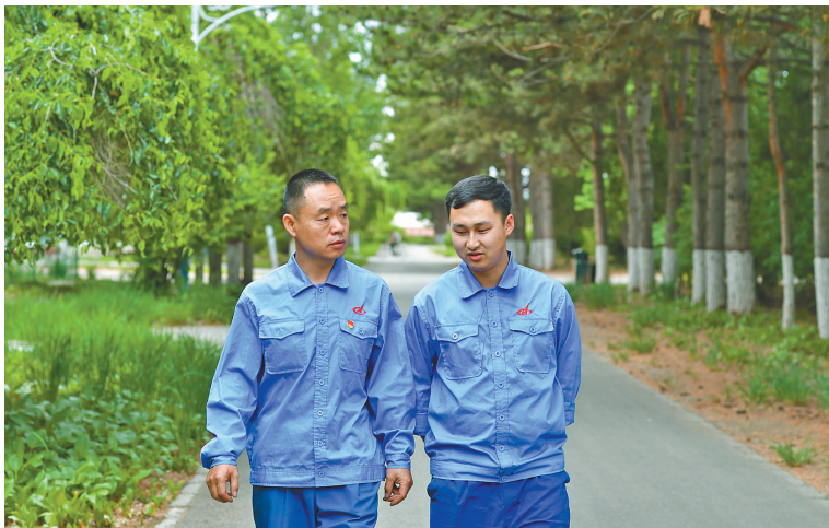
休闲时间交流经验。

雨露滋养大地,也为炎炎夏日带来一阵清凉。当雨水与我们的生活产生紧密联系的时候,一些有趣的画面便来了。