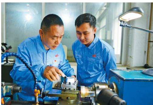
给徒弟讲解车床使用要领。