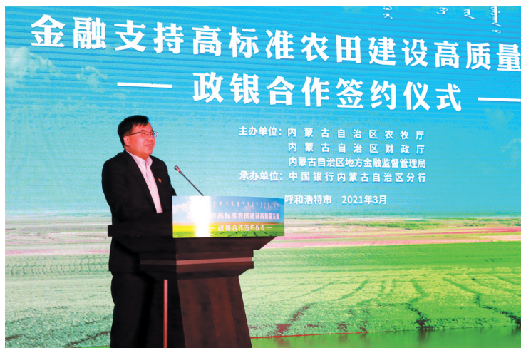
承办金融支持高标准农田建设高质量发展政银合作签约仪式。