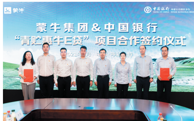
为蒙牛集团打造“青贮”“牛口贷”专属产品。

亿元;围绕伊利、蒙牛、正大等区内绿色产业的核心企业,提供承销超短融债券、股权质押贷款、债券直融等多元化产品组合方案,着力打造示范企业产业链全生命周期绿色金融服务,全面推进绿色转型,激发绿色发展新活力。截至6月末,绿色信贷余额达365亿元,较上年末新增44亿元。