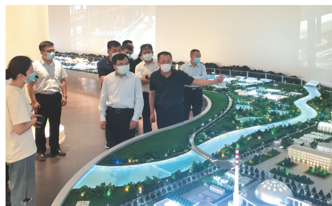
与鄂尔多斯集团携手共进。

提供各类渠道和方案,鼎力支持优然牧业、大中矿业、朝聚眼科成功上市,为全区优秀企业利用资本市