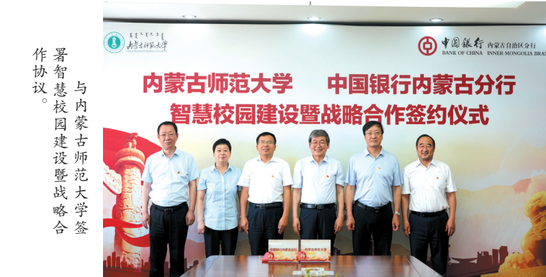
与内蒙古师范大学签署智慧校园建设暨战略合作协议。

元、人文、智慧、安全、和谐的“智慧校园”体系;与内蒙古妇幼保健院开展“智慧医院”合作,投产“北方国药智慧医疗”“鄂绒智慧园区”等13个重点项目;与包头市政府全面开展“互联网+政务服务”场景建设,支持自治区住建厅“大数据应用平台”、公共资源交易中心“一张网”系统建设,助力自治区政务服务数字化转型,为服务科技兴国战略贡献金融力量。