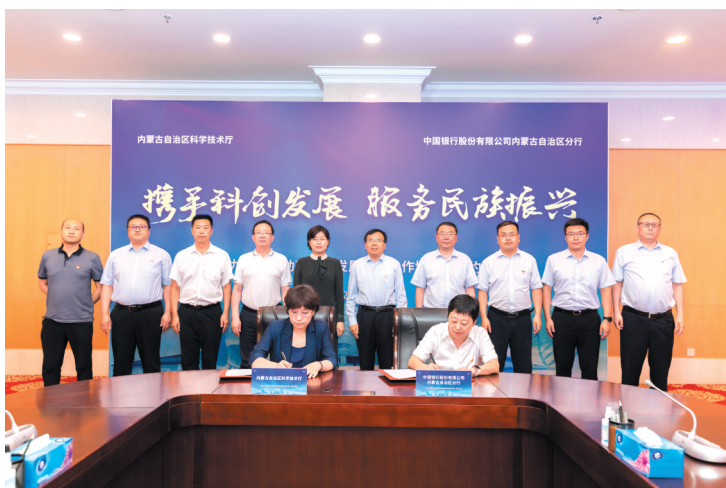
与自治区科技厅签署金融助力创新驱动高质量发展战略合作协议。