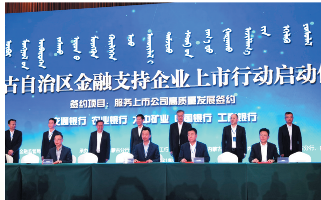
参加自治区金融支持企业上市行动启动仪式。