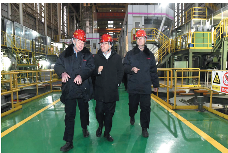
助力自治区工业长子包钢集团转型升级。