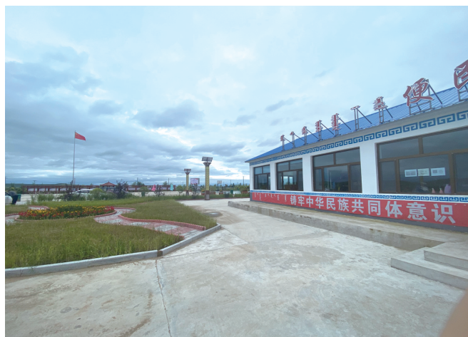
营造民族团结氛围,铸牢中华民族共同体意识。