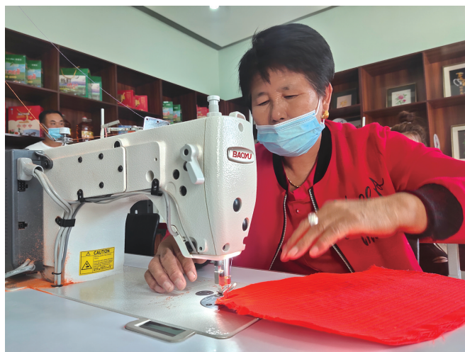
图牧吉镇靠山嘎查扶贫车间成了各族群众致富车间。

回首过往,踏歌前行。扎赉特旗各族儿女牢记习近平总书记嘱托,共居、共学、共事、共乐,向着巩固提升全国民族团结进步示范旗创建成果的目标前进,凝聚起民族团结的磅礴伟力,书写着中华民族大团结的新时代答卷。