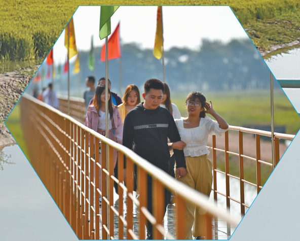
各地游客前来观赏特色稻田。