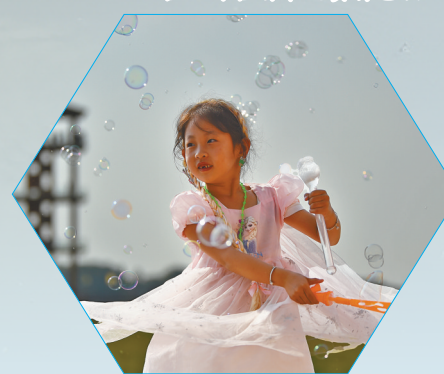
一位小朋友在稻田边快乐玩耍。