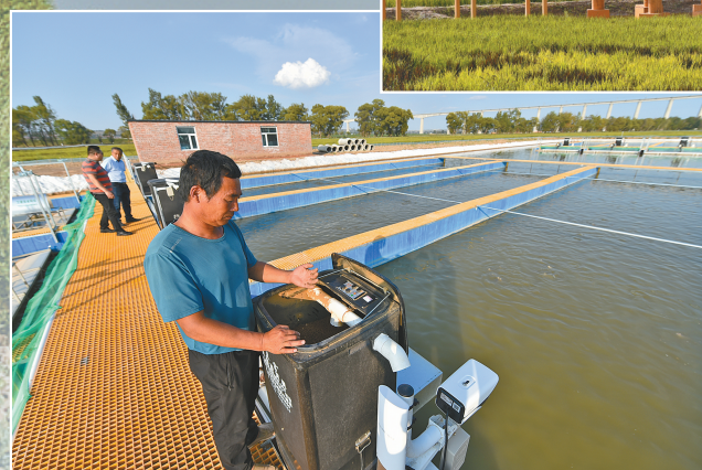
工作人员往万亩养鱼池中投放饲料。