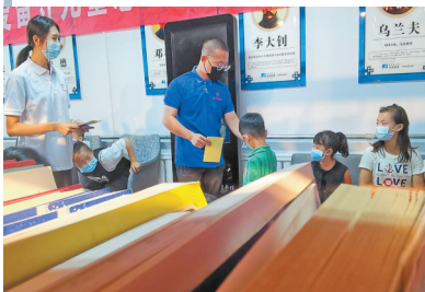
给孩子们贴奖励小花。