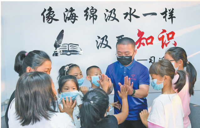
与孩子们鼓励互动