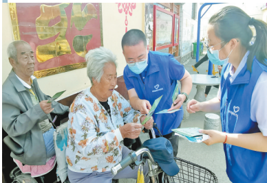
讲解垃圾分类知识。