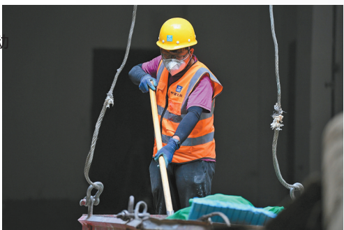
不挑活 不偷懒 肯吃苦