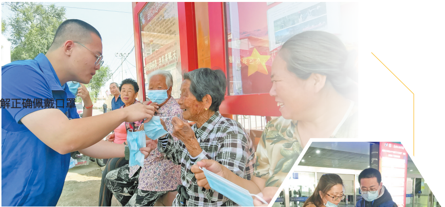
讲解正确佩戴口罩