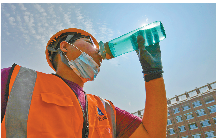
打工生活苦中有乐