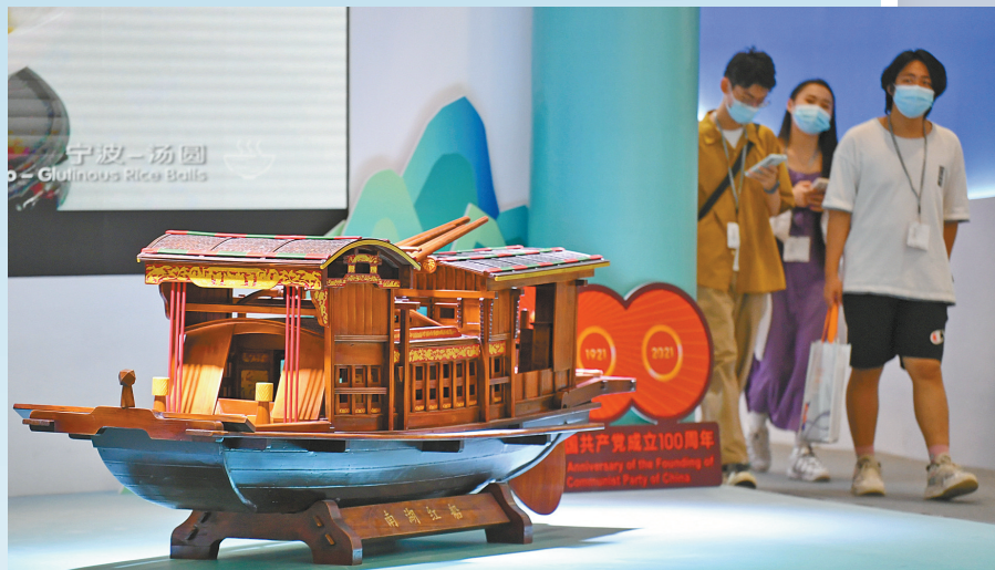
浙江馆南湖红船模型。