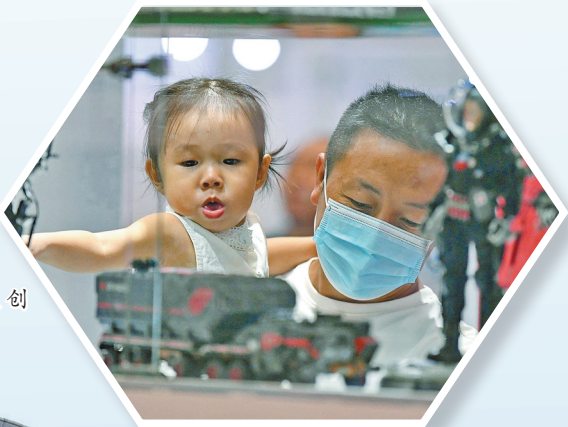
欣赏文创手办模型。