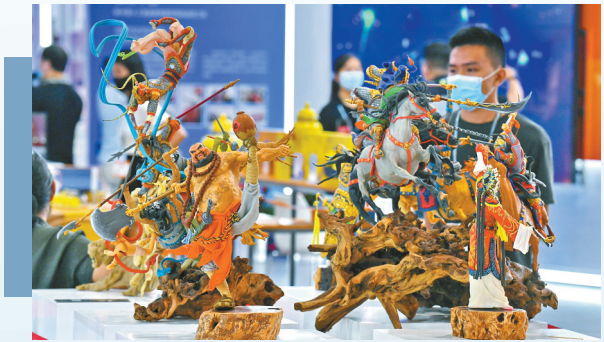
以“四大名著”人物打造的文化产品。