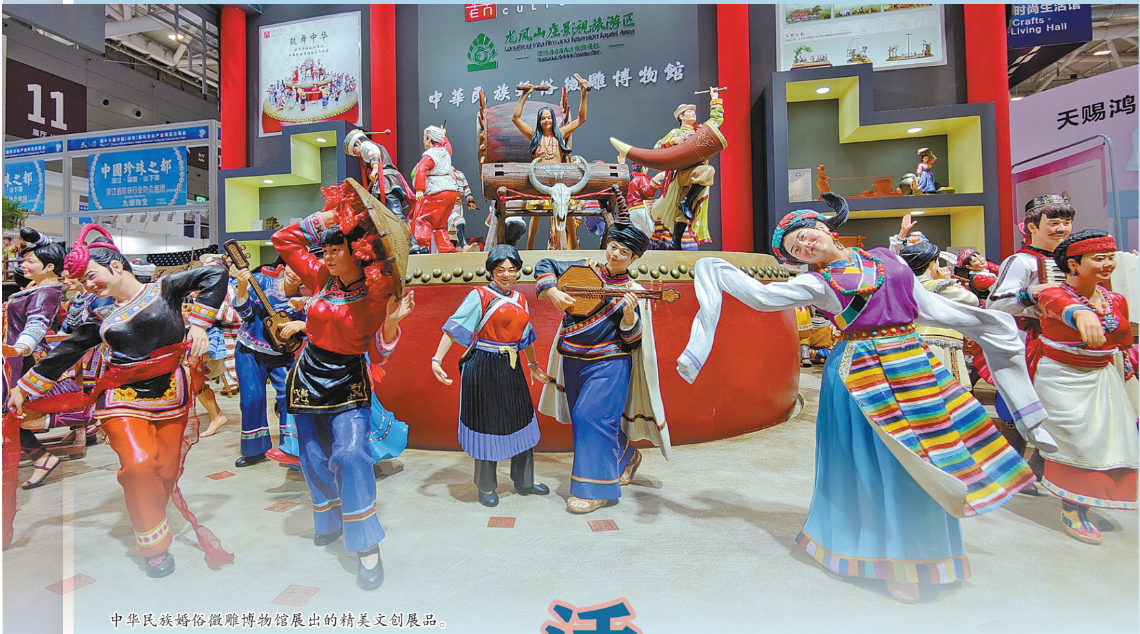
中华民族民俗博物馆展出的精美文创展品。