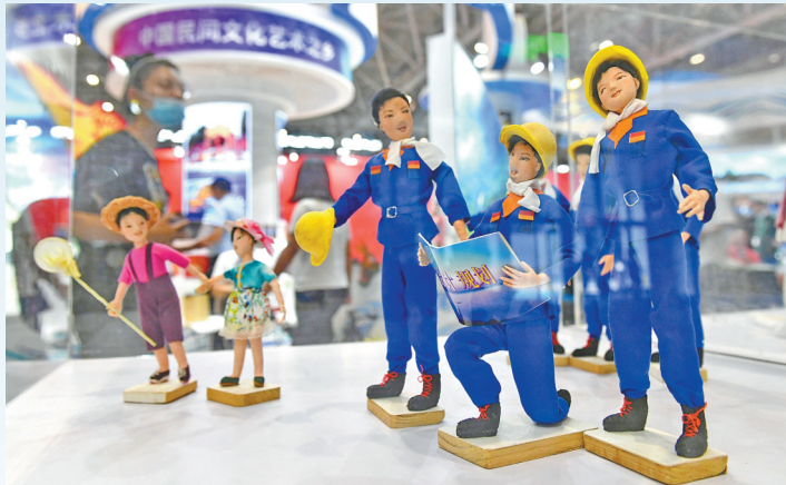
广东省省级非遗项目肖氏棉塑。