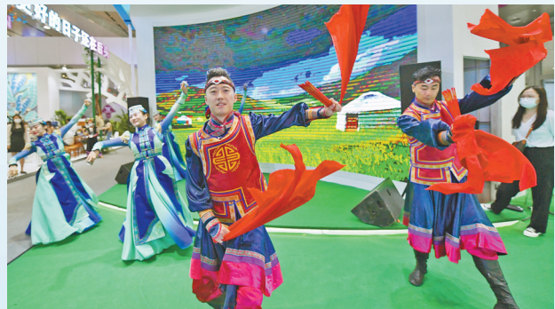
乌兰牧骑队员表演民族舞蹈。