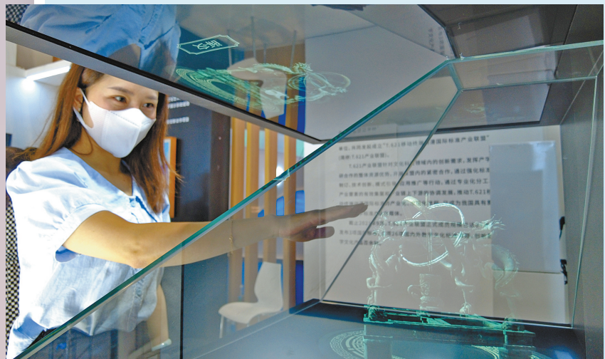
科技范儿十足的文创产品。