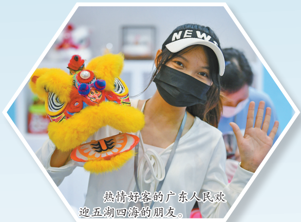
热情好客的广东人民欢迎五湖四海的朋友。