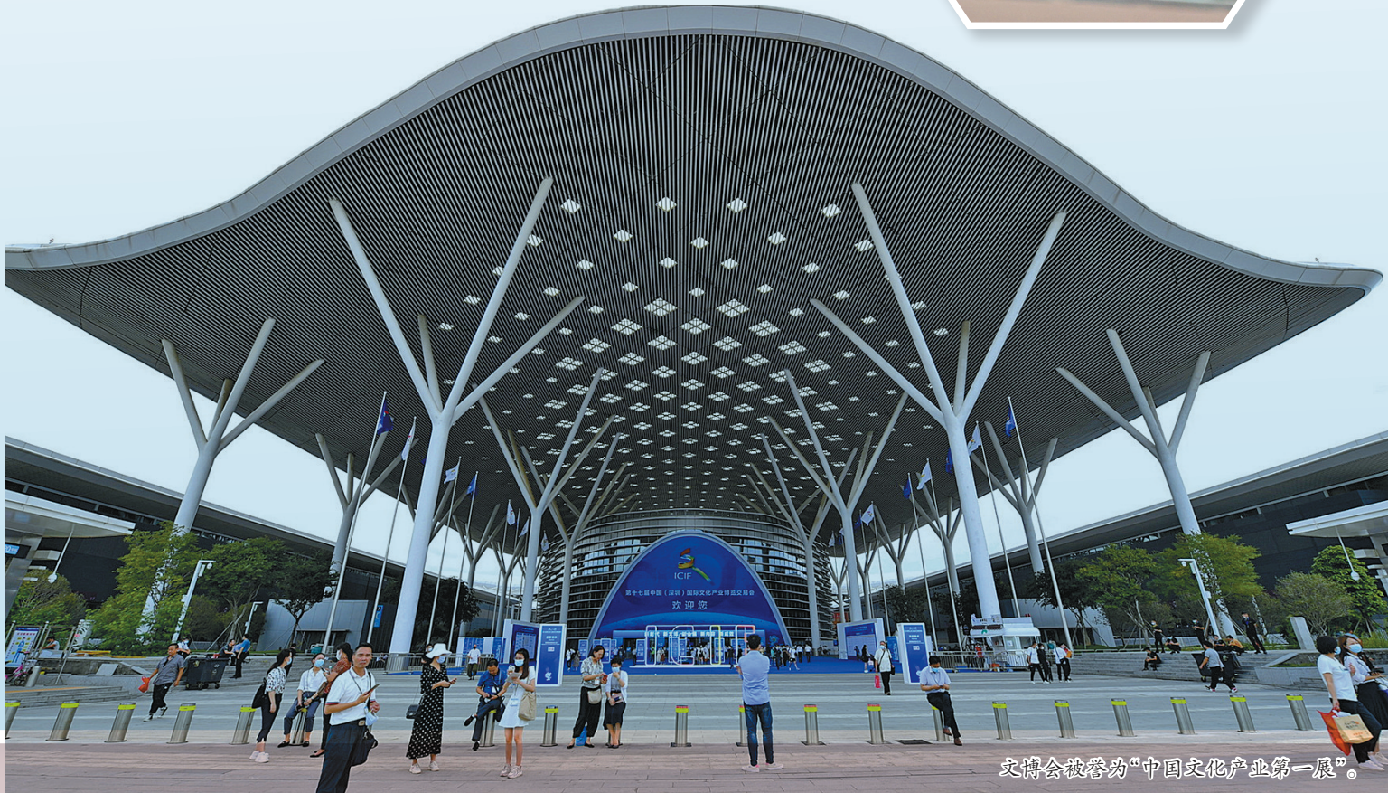
文博会被誉为“中国文化产业第一展”。