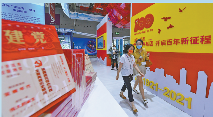
红色元素遍布各参展展馆。