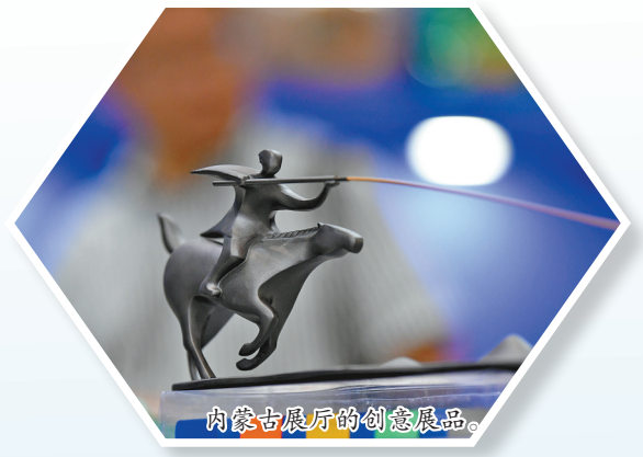
内蒙古展厅的创意展品。