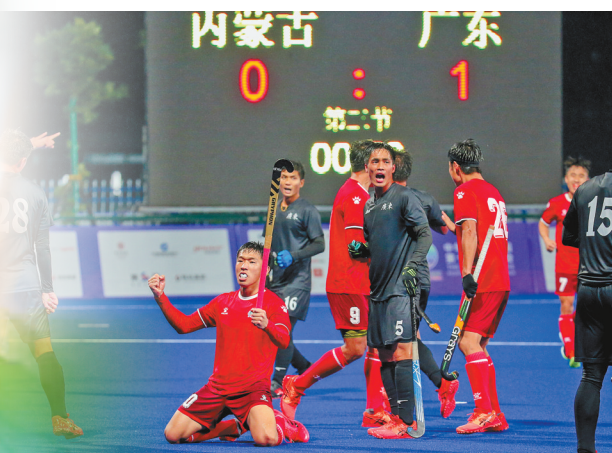
滂沱大雨中内蒙古男曲(红)为荣耀而战。