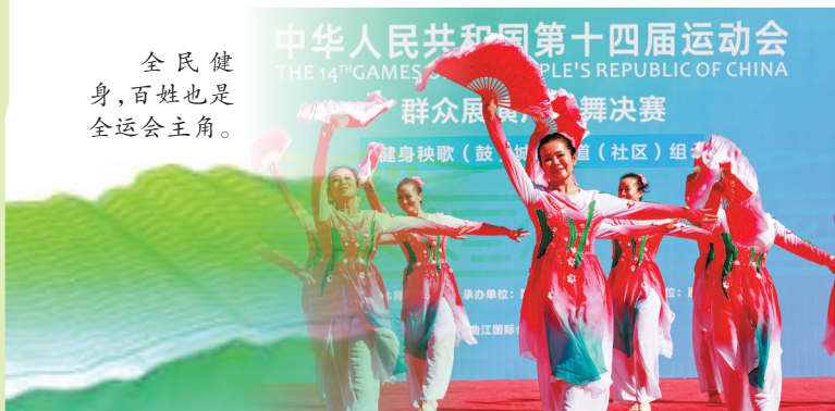
全民健身,百姓也是全运会主角。