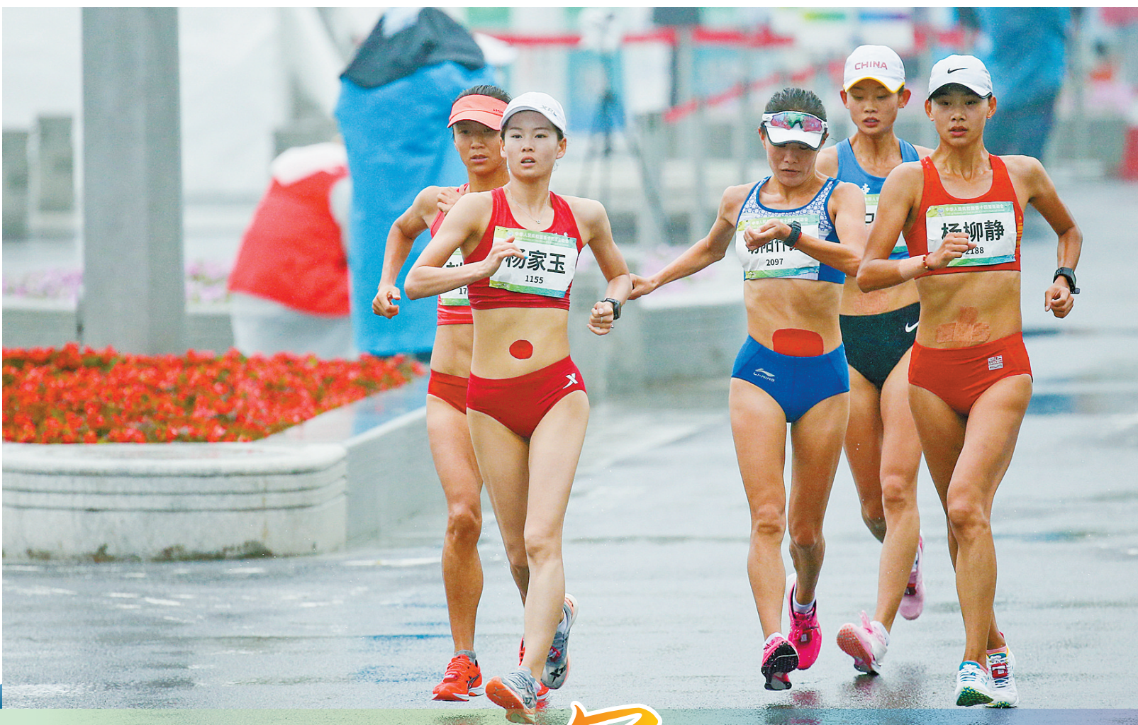
女子10公里竞走杨家玉夺冠。