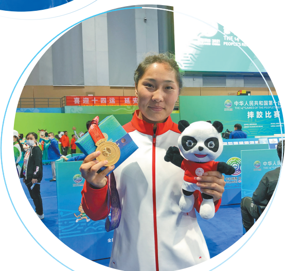
钱德根查干获自由式摔跤76公斤级冠军。