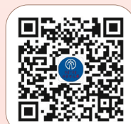
《内蒙古文艺》微信公众号