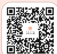
《内蒙古文艺》客户端

一首沧浪的诗,就可以化艰难为坦途;如橡的巨手,就可以描绘当年,金戈铁马,气吞万里如虎。