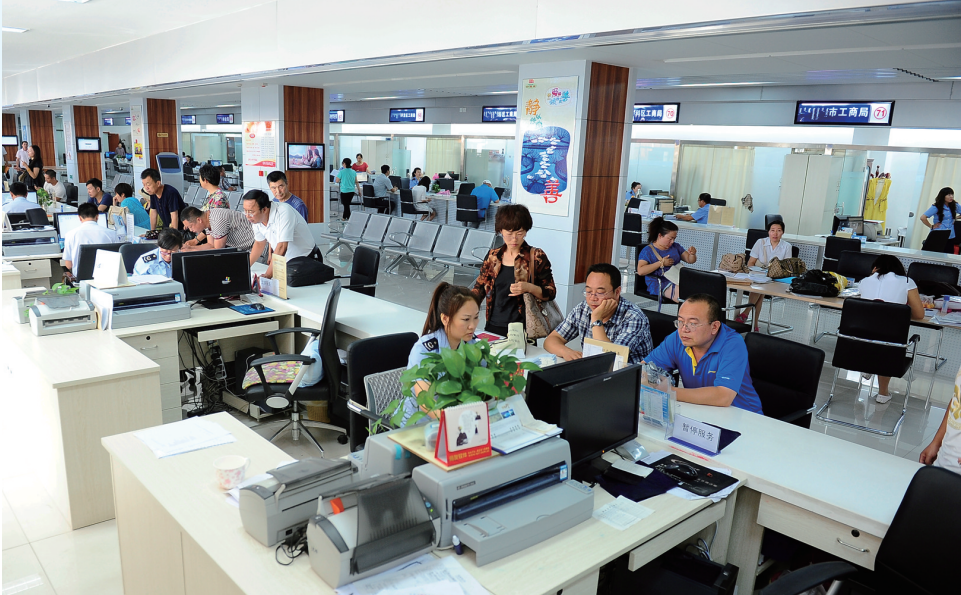
通辽市政务中心一角。