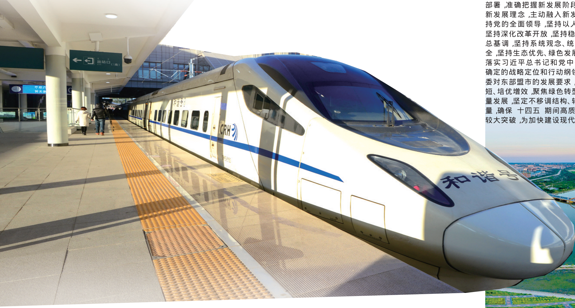
进入高铁时代。

担当使命路犹长，潮起扬帆再出发。承载通辽市人民殷切期望，备受社会各界广泛关注的中国共产党通辽市第六次代表大会于9月29日胜利闭幕。会议坚持以习近平新时代中国特色社会主义思想为指导，以“聚焦绿色转型，聚力高质量发展，加快建设现代化区域中心城市而奋斗”为主题，全面系统回顾了通辽市第五次党代会以来取得的发展成就、积累的基本经验，理性客观分析了当前存在的突出问题、面临的机遇挑战，紧扣习近平总书记和党中央赋予内蒙古建设“两个屏障”“两个基地”“一个桥头堡”的战略定位和自治区党委对东部盟市的工作要求，科学谋划今后五年的战略目标、主要任务和重大举措，为通辽市未来发展指明了方向、提供了遵循。