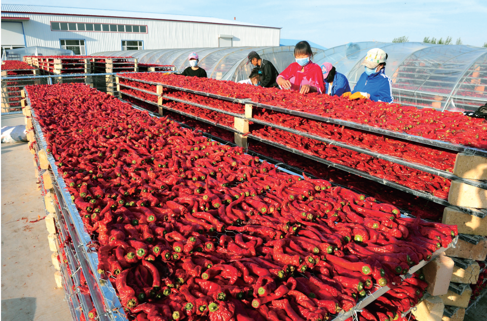
精选红干椒。