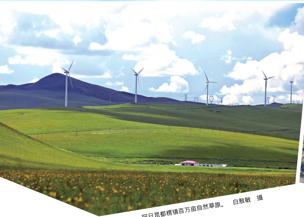
阿日昆都楞镇百万亩自然草原。白放歌 摄