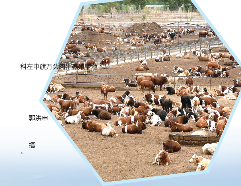
科在中旗万头肉牛养殖基地。