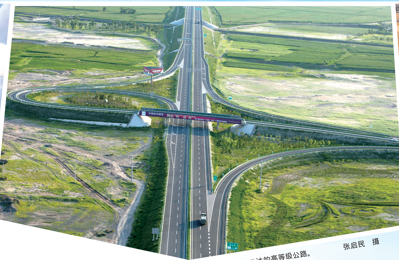
四通八达的高等级公路。