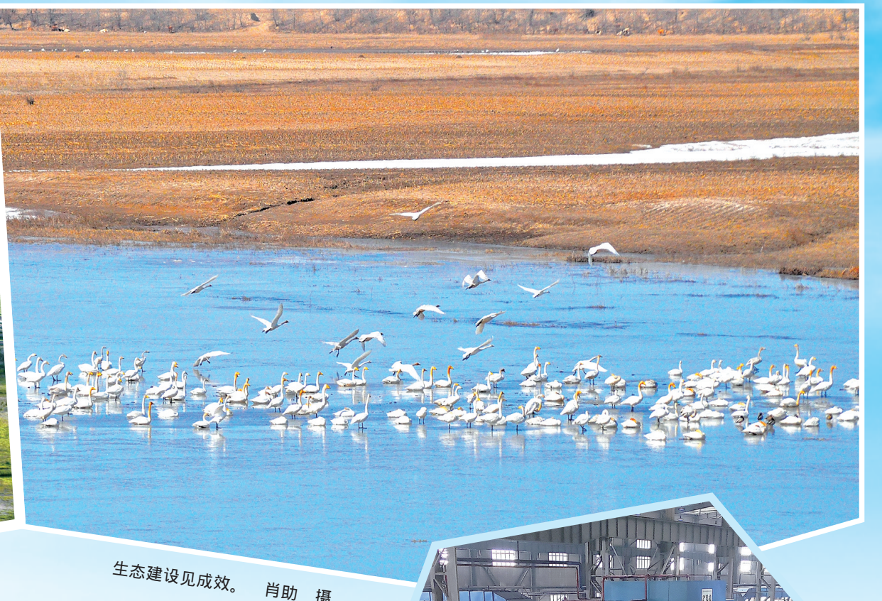
生态建设见成效。