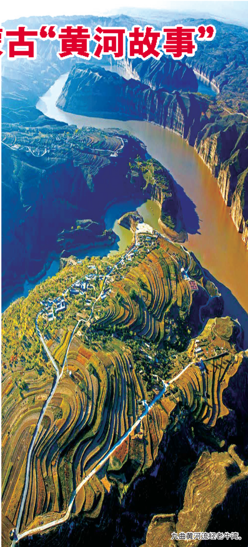
九曲黄河流经老牛湾。