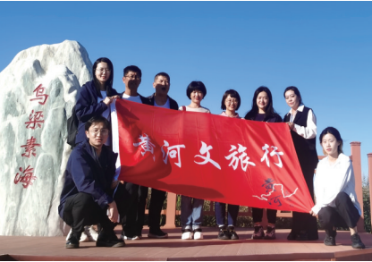
在巴彦淖尔乌梁素海调研。