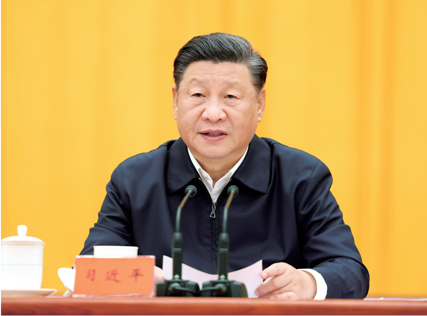
10月13日至14日,中央人大工作会议在北京召开。中共中央总书记、国家主席、中央军委主席习近平出席会议并发表重要讲话。

新华社北京10月14日电 中央人大工作会议10月13日至14日在北京召开。中共中央总书记、国家主席、中央军委主席习近平出席会议并发表重要讲话,强调人民代表大会制度是符合我国国情和实际、体现社会主义国家性质、保证人民当家作主、保障实现中华民族伟大复兴的好制度,是我们党领导人民在人类政治制度史上的伟大创造,是在我国政治发展史乃至世界政治发展史上具有重大意义的全新政治制度。我们要坚持中国特色社会主义政治发展道路,坚持和完善人民代表大会制度,加强和改进新时代人大工作,不断发展全过程人民民主,巩固和发展生动活泼、安定团结的政治局面。 中共中央政治局常委李克强、汪洋、王沪宁、赵乐际、韩正,国家副主席王岐山出席会议。中共中央政治局常委、全国人大常委会委员长栗战书作总结讲话。 习近平在讲话中指出,人民代表大会制度,坚持中国共产党领导,坚持马克思主义国家学说的基本原则,适应人民民主专政的国体,有效保证国家沿着社会主义道路前进。人民代表大会制度,坚持国家一切权力属于人民,最大限度保障人民当家作主,把党的领导、人民当家作主、依法治国有机结合起来,有效保证国家治理跳出治乱兴衰的历史周期率。60多年来特别是改革开放40多年来,人民代表大会制度为党领导人民创造经济快速发展奇迹和社会长期稳定奇迹提供了重要制度保障。 习近平强调,党的十八大以来,党中央统筹中华民族伟大复兴战略全局和世界百年未有之大变局,从坚持和完善党的领导、巩固中国特色社会主义制度的战略全局出发,继续推进人民代表大会制度理论和实践创新,提出一系列新理念新思想新要求,强调必须坚持中国共产党领导,必须坚持用制度体系保障人民当家作主,必须坚持全面依法治国,必须坚持民主集中制,必须坚持中国特色社会主义政治发展道路,必须坚持推进国家治理体系和治理能力现代化。 习近平指出,当今世界正经历百年未有之大变局,制度竞争是综合国力竞争的重要方面,制度优势是一个国家赢得战略主动的重要优势。历史和现实都表明,制