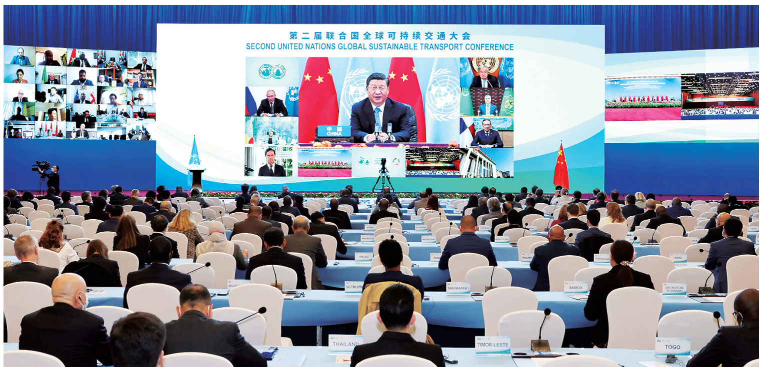
10月14日晚,国家主席习近平以视频方式出席第二届联合国全球可持续交通大会开幕式并发表题为《与世界相交 与时代相通 在可持续发展道路上阔步前行》的主旨讲话。

新华社北京10月14日电 国家主席习近平14日晚以视频方式出席第二届联合国全球可持续交通大会开幕式并发表题为《与世界相交 与时代相通 在可持续发展道路上阔步前行》的主旨讲话。(讲话全文另发) 习近平指出,交通是经济的脉络和文明的纽带。从古丝绸之路的驼铃帆影,到航海时代的劈波斩浪,再到现代交通网络的四通八达,交通推动经济融通、人文交流,使世界成了紧密相连的地球村。当前,百年变局和世纪疫情叠加,给世界经济发展和民生改善带来严重挑战。我们要顺应世界发展大势,推进全球交通合作,书写基础设施联通、贸易投资畅通、文明交融沟通的新篇章。 第一,坚持开放联动,推进互联互通。要推动建设开放型世界经济,不搞歧视性、排他性规则和体系,推动经济全球化朝着更加开放、包容、普惠、平衡、共赢的方向发展。要加强基础设施硬联通、制度规则软联通,促进陆、海、天、网四位一体互联互通。 第二,坚持共同发展,促进公平普惠。各国一起发展才是真发展,大家共同富裕才是真富裕。只有解决好发展不平衡问题,才能够为人类共同发展开辟更加广阔的前景。要发挥交通先行作用,加大对贫困地区交通投入,让贫困地区经济生因路而兴。加强南北合作、南南合作,为最不发达国家、内陆发展中国家交通基础设施建设提供更多支持,促进共同繁荣。 第三,坚持创新驱动,增强发展动能。要大力发展智慧交通和智慧物流,推动大数据、互联网、人工智能、区块链等新技术与交通行业深度融合,使人享其行、物畅其流。 第四,坚持生态优先,实现绿色低碳。建立绿色低碳发展的经济体系,促进经济社会发展全面绿色转型,才是实现可持续发展的长久之策。 ■下转第2版