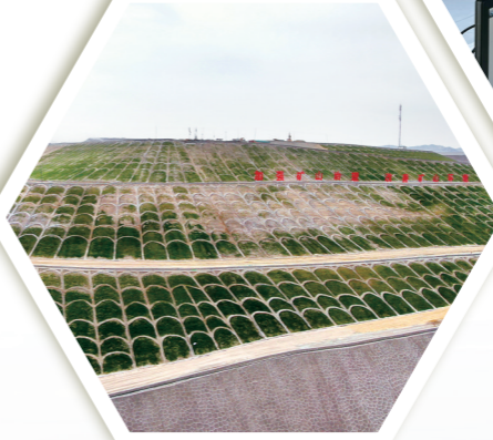
乌达区苏海图小铁帽子采空区综合治理项目初见成效。金泉 摄