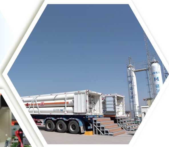
自治区首座加氢站在乌海市建成。