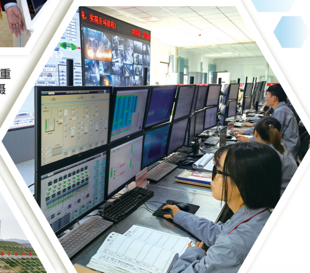
赛思普科技有限公司利用氢基熔融还原新工艺推动传统“碳冶金”向新型“氢冶金”转变。