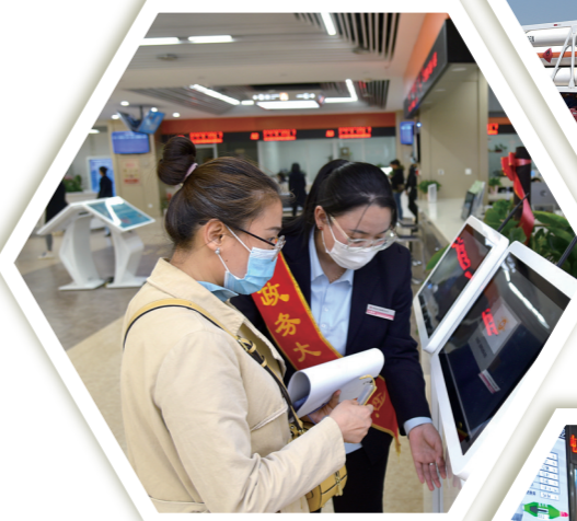
打造一流营商环境为重点项目建设护航。