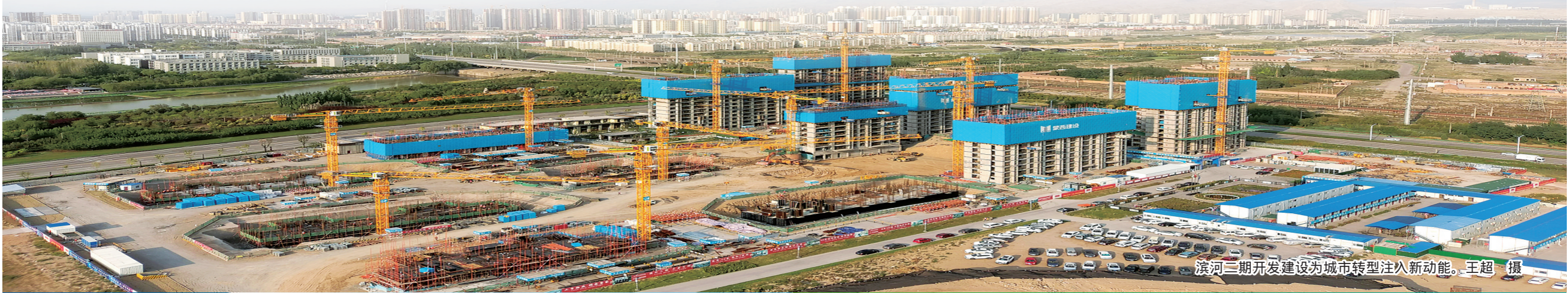
滨河二期开发建设为城市转型注入新动能。