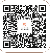
《内蒙古文艺》客户端