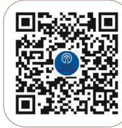
《内蒙古文艺》微信公众号