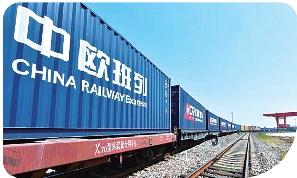
支持中欧班列发展。