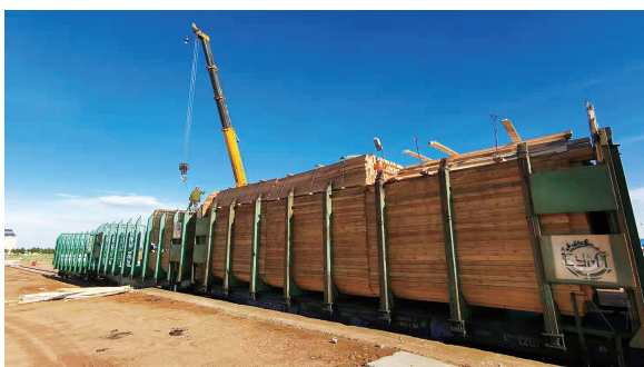
支持企业木材进口。