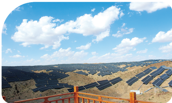
支持山地光伏项目。

既是对各级党委政府大力支持的最好反馈,也是金融机构积极响应支持实体经济、民营经济、支持地方高质量发展的具体举措。该行通过进口固定资产贷款支持企业从德国、意大利等国家采购乙二醇生产设备,推动企业加快精细化工产业发展,建设高端能化基地,助力自治区新兴煤化工产业结构进一步转型优化、高质量发展。