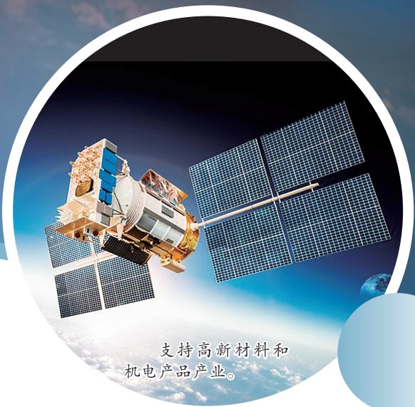
支持新材料和机电产品产业。