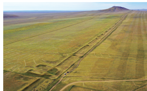
克什克腾旗金界壕。