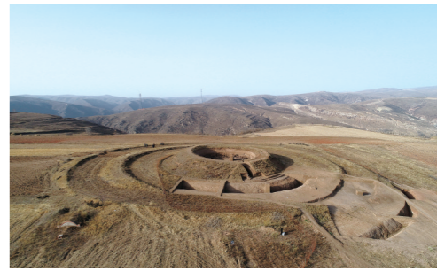
武川县坝顶北魏祭祀建筑遗址。