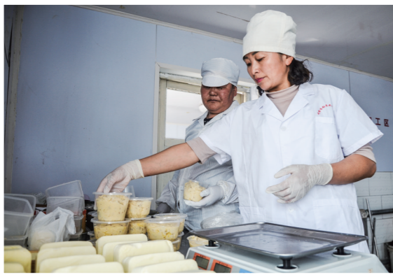
延长畜牧业产业链。