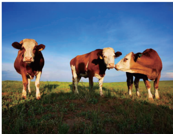
优质西门塔尔牛安家阿巴嘎草原。