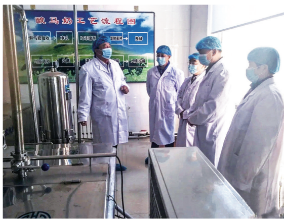
现代化酸马奶加工企业。