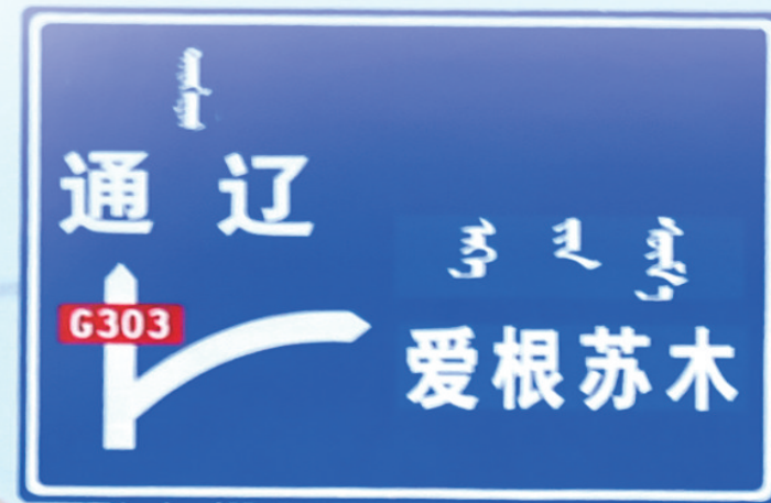
11月10日,在赤峰市303国道上,作业车辆正在清雪。

眼下,通辽市的暴风雪已经过去,但抗击雪灾的斗争没有停止,一个个地不言弃、积极自救,雪中送炭、互帮互助的场景仍在继续。