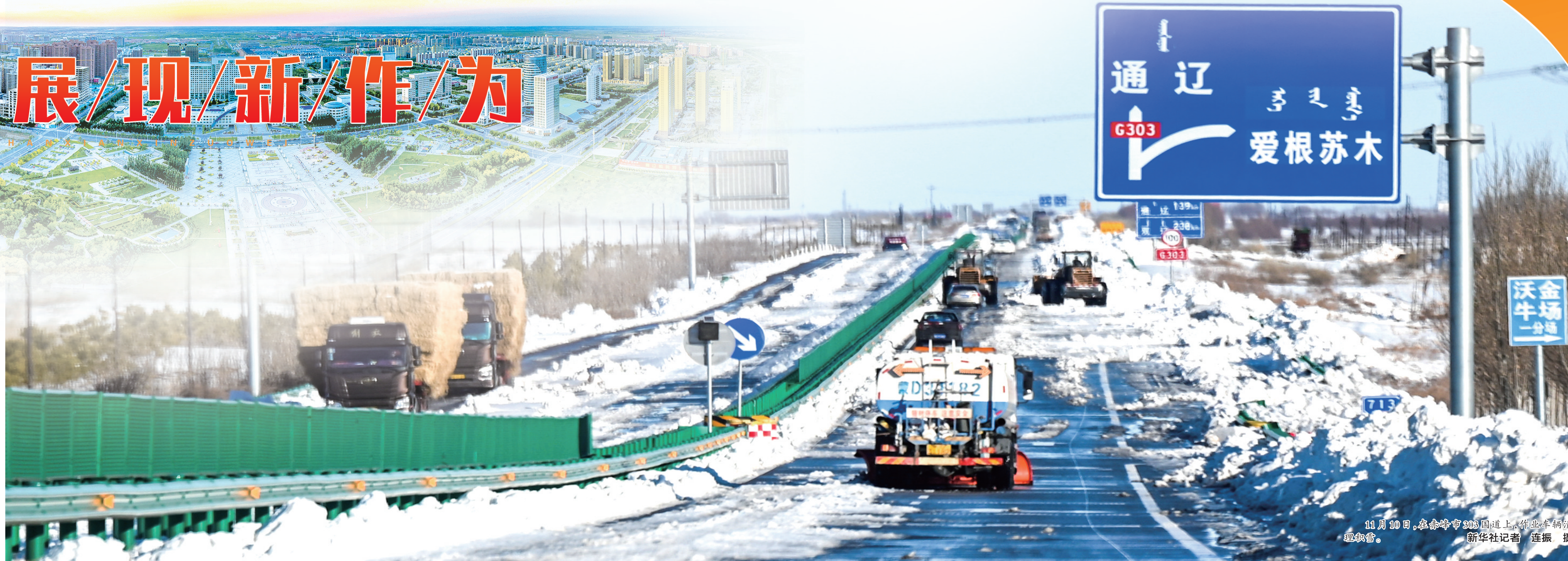
11月10日,在赤峰市303国道上,作业车辆正在清雪。