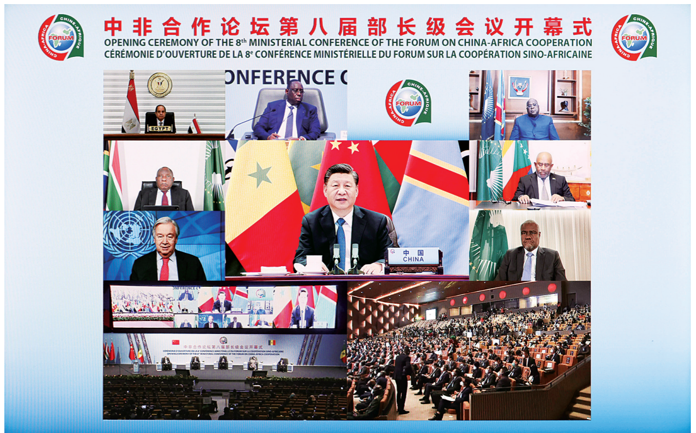
11月29日晚,国家主席习近平在北京以视频方式出席中非合作论坛第八届部长级会议开幕式并发表题为《同舟共济,继往开来,携手构建新时代中非命运共同体》的主旨演讲。

新华社北京11月29日电 (记者 郑明达)国家主席习近平29日晚在北京以视频方式出席中非合作论坛第八届部长级会议开幕式。人民大会堂东大厅内,中国和53个非洲国家国旗以及非洲联盟旗帜组成的旗阵恢弘大气、热烈奔放,昭示着中非历史悠久的友好情谊。习近平发表题为《同舟共济,继往开来,携手构建新时代中非命运共同体》的主旨演讲。(演讲全文另发) 习近平指出,今年是中非开启外交关系65周年。65年来,中非双方在反帝反殖的斗争中结下了牢不可破的兄弟情谊,在发展的征程上走出了特色鲜明的合作之路,在纷繁复杂的变局中谱写了守望相助的精彩篇章,为构建新型国际关系树立了光辉典范。 习近平强调,中非关系为什么好?中非友谊为什么深?关键在于双方缔造了历久弥坚的中非友好合作精神,那就是真诚友好、平等相待、互利共赢、共同发展、主持公道、捍卫正义、顺应时势、开放包容。这是中非双方数十年来休戚与共、并肩奋斗的真实写照,是中非友好关系继续开来的力量源泉。 习近平指出,今年是中国恢复在联合国合法席位50周年。我谨向当年支持中国的广大非