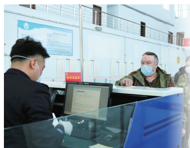
俄罗斯的司乘人员通过安检。