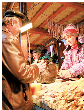
贝加尔湖畔的鱼市。