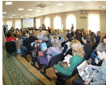
呼伦贝尔市旅游企业通过互联网与俄罗斯赤塔州旅游企业对接业务。