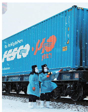
待检出境的中欧班列。