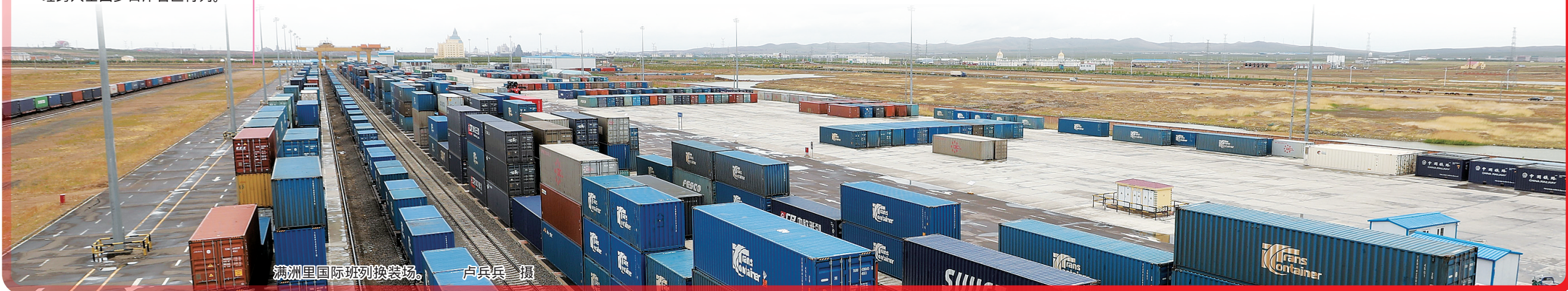
满洲里国际班列换装场。