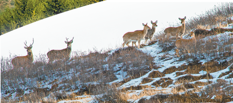
野生动物“落户”苏木山。