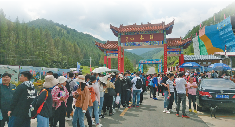
苏木山每年吸引数十万游客观光。(资料图片)