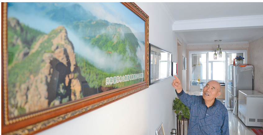
一生的成就值得骄傲。