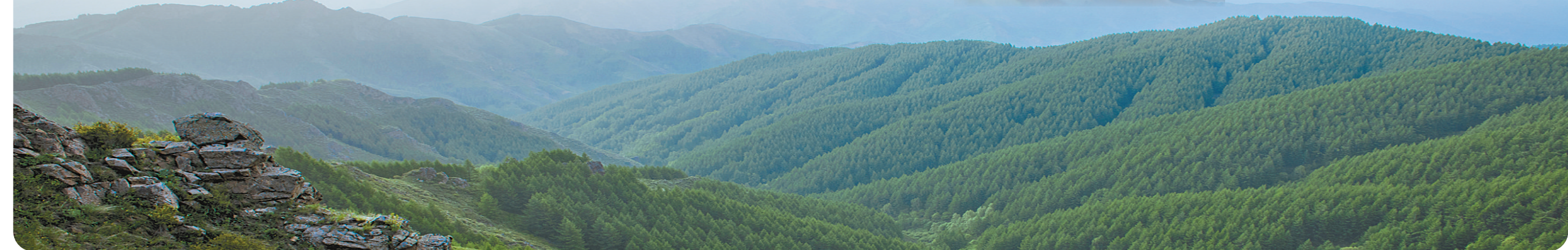
苏木山林场成为华北最大的人工林场。