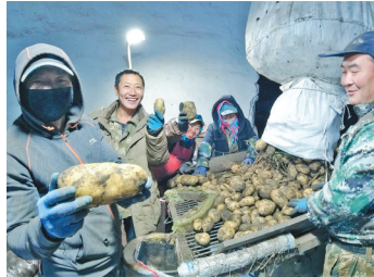
能储存7万吨土豆的仓储窖让村民的心里有了底气。

威风锣鼓喧天,美丽乡村建设新曲正酣。奋斗镇友联村集种植养殖、仓储物流、采摘娱乐、旅游观光、餐饮养生于一体的发展布局让产业兴旺,生态宜居,乡风文明,治理有效,生活富裕的新农村画卷呈现在778户2278名村民面前。