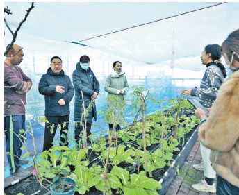
采摘园里的农技人员查看果蔬长势。