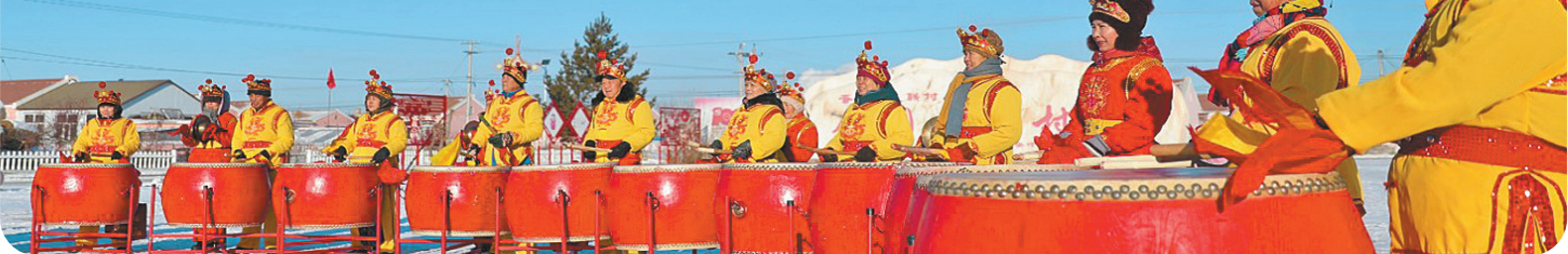
幸福的锣鼓敲起来。