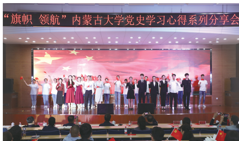
旗帜领航 学生理论学马学骑兵举办党史学习教育心得系列分享会。

2020年,内蒙古大学铸牢中华民族共同体意识研究培育基地获得国家四部委批准。2021年,学校加大基地建设力度,设立10项专项课题,整合校内外优质资源,为筑牢祖国北疆安全稳定屏障提供理论支撑和智力支持。目前,基地获批4项国家社科基金项目,承担中央统战部、