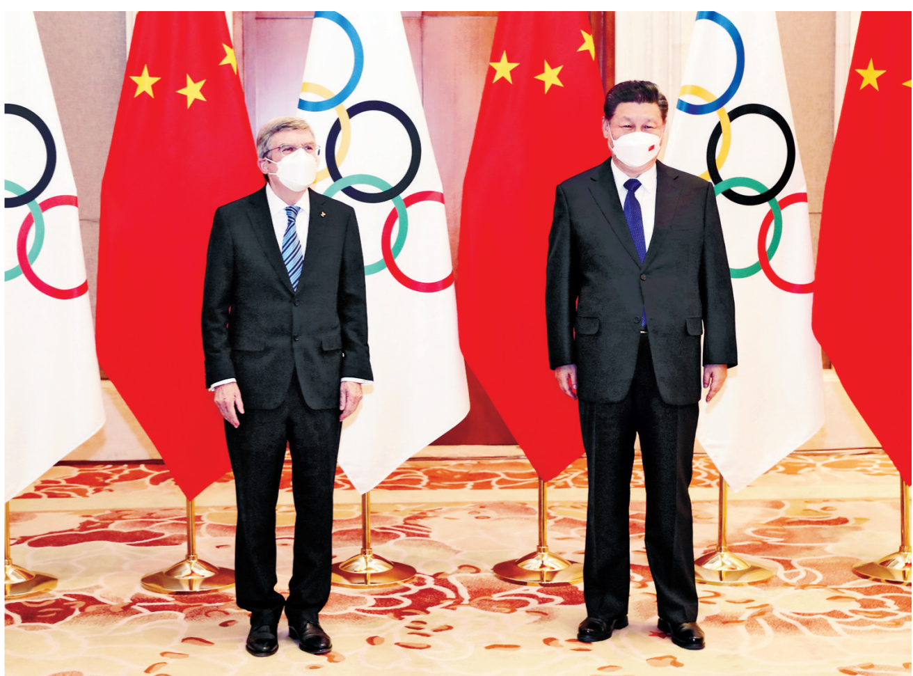
1月25日,国家主席习近平在北京钓鱼台国宾馆会见国际奥委会主席巴赫。