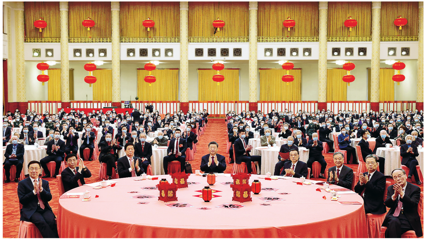
1月30日,中共中央、国务院在北京人民大会堂举行2022年春节团拜会。中共中央总书记、国家主席、中央军委主席习近平发表讲话。