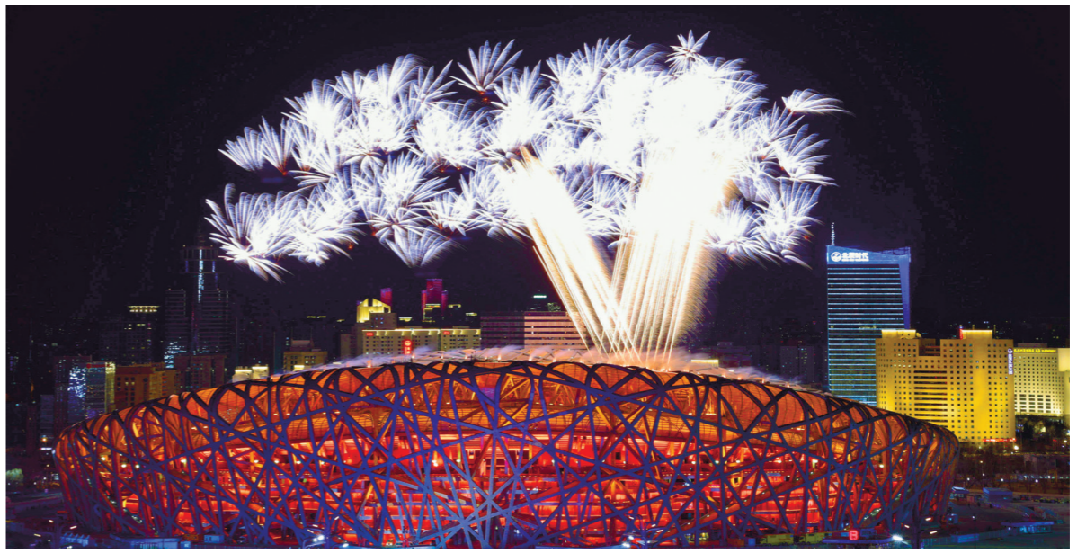
1月7日晚,第二十四届冬季奥林匹克运动会开幕式在国家体育场举行。这是焰火表演。