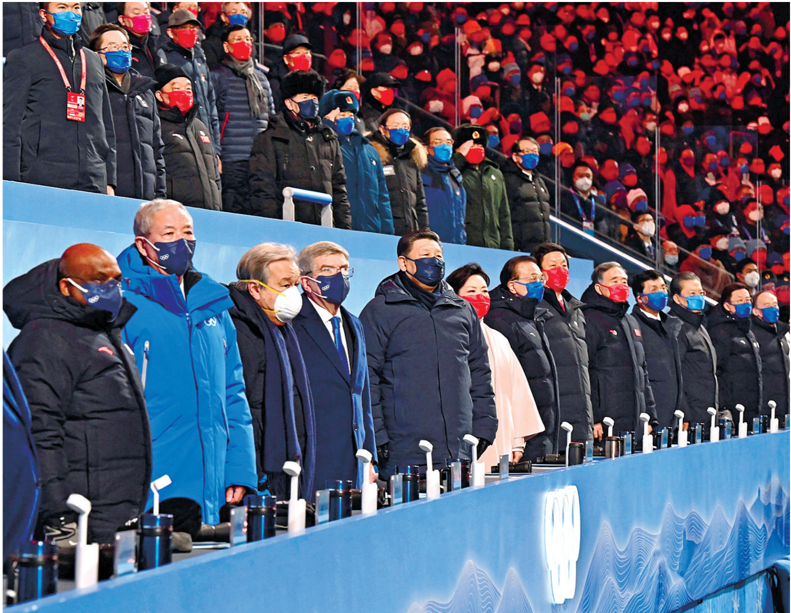
2月4日晚,北京第二十四届冬季奥林匹克运动会开幕式在国家体育场隆重举行。习近平、李克强、栗战书、汪洋、王沪宁、赵乐际、韩正、王岐山等党和国家领导人出席开幕式。

新华社北京2月4日电 筑梦冰雪,同向未来。2022年2月4日晚,举世瞩目的北京第二十四届冬季奥林匹克运动会开幕式在国家体育场隆重举行。国家主席习近平出席开幕式并宣布本届冬奥会开幕。中华文明与奥林匹克运动再度携手,奏响全人类团结、和平、友谊的华美乐章。