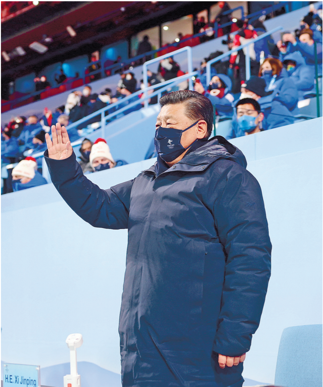
2月4日晚,北京第二十四届冬季奥林匹克运动会开幕式在国家体育场隆重举行。这是国家主席习近平在主席台上向大家挥手致意。

习近平出席开幕式并宣布本届冬奥会开幕 李克强栗战书汪洋王沪宁赵乐际韩正王岐山 国际奥委会主席巴赫 来自世界各地的领导人和贵宾等出席