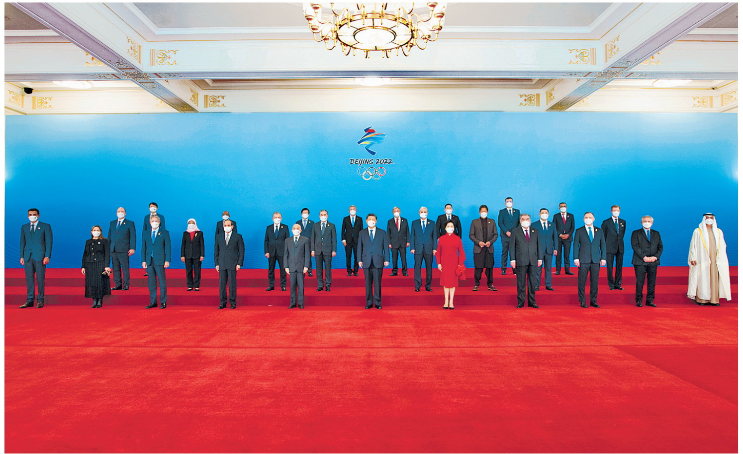
2月5日中午,国家主席习近平和夫人彭丽媛在北京人民大会堂金色大厅举行宴会,欢迎出席北京2022年冬奥会开幕式的国际贵宾。这是习近平和彭丽媛同国际贵宾一起合影留念。